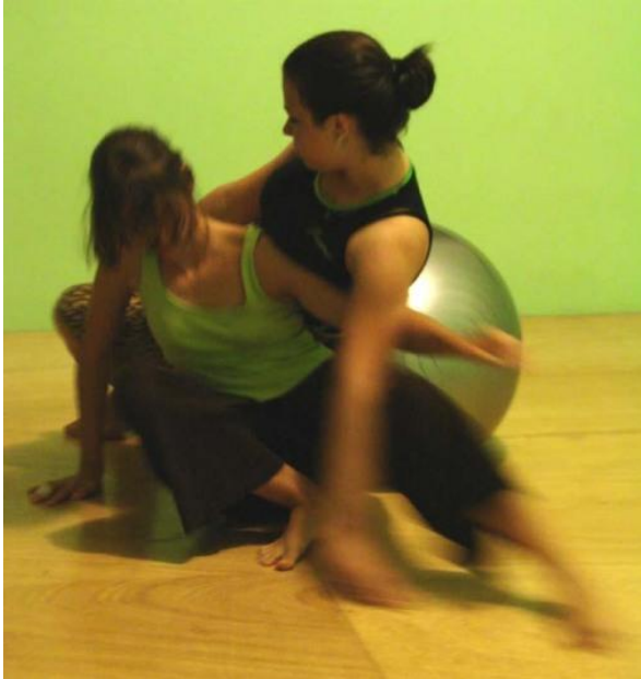
Figura 3. Contato-improvisação com o uso de objeto