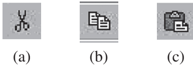
Figura 2. Ícones do Windows.

ícone, que representa uma tesoura, atua como pista que ativa e disponibiliza para uso informações da memória relacionadas ao conceito do que significa recortar um trecho do texto que está sendo redigido, bem como os procedimentos necessários para executar esta ação ( vide Figura 2 item a). Por outro lado, o comando “colar” está associado a um símbolo que não guarda relação direta com a ação que ele representa. Assim, para pessoas com pouca experiência este símbolo não atua como uma pista forte (em alguns casos como pista alguma) do padrão de ativação para as competências necessárias à ação “colar”. Mesmo para usuários experientes, a falta de uma representação direta com as ferramentas do dia-a-dia pode induzir a erros, levando-os a acionar o ícone de “copiar” ( vide Figura 2 item b), em vez do ícone “colar” ( vide Figura 2 item c), que é o desejado.