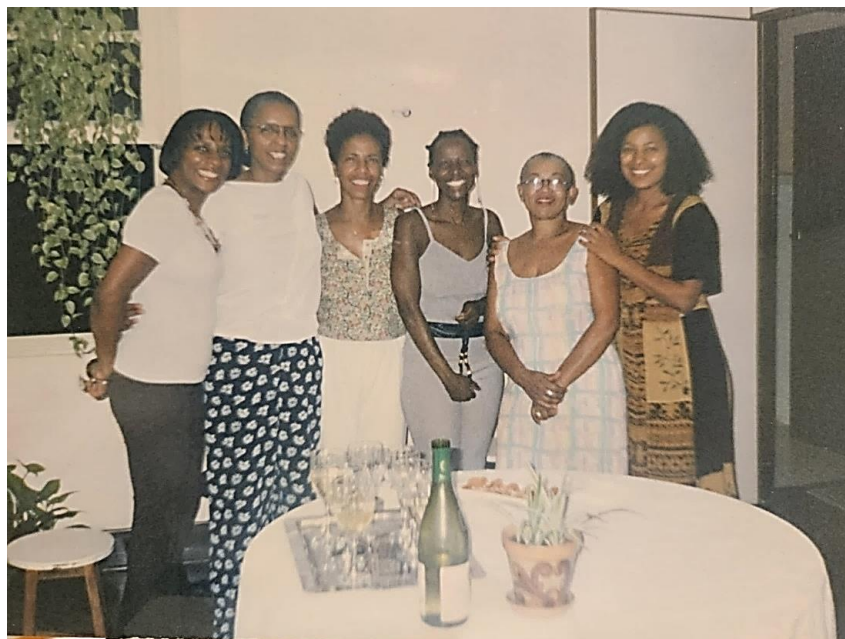
Figura 7 – 1ª Diretoria do Instituto AMMA Psique e Negritude, 02 de fevereiro de 2001 – São Paulo.