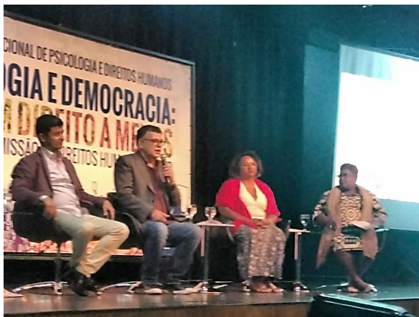
Figura 8 - IV Encontro Nacional das Comissões de Direitos Humanos do Sistema Conselhos de Psicologia, em 2002.