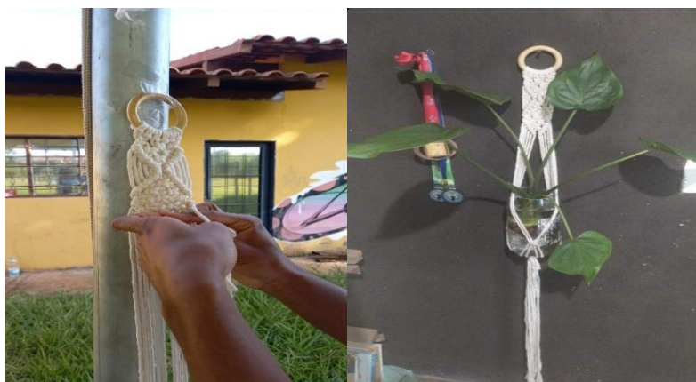
Imagens 10 e 11