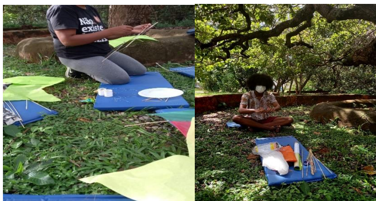
Imagens 4 e 5