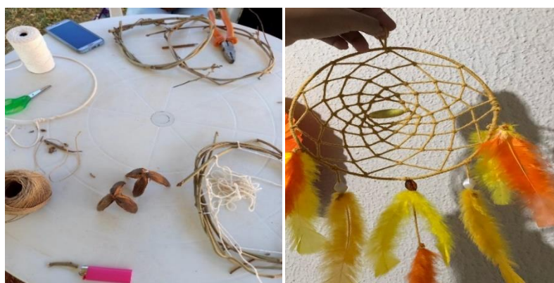
Imagens 12 e 13

Nota: Oficina de Filtro dos Sonhos com materiais do bioma cerrado