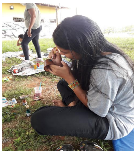
Imagens 8 e 9