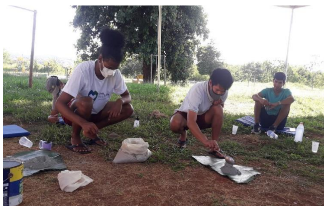
Nota: Oficina de construção de pequenos vasos de cimento