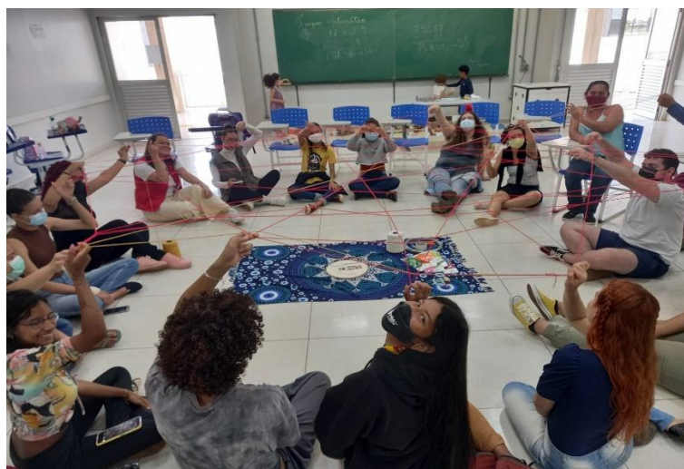
Imagens 14, 15, 16 e 17