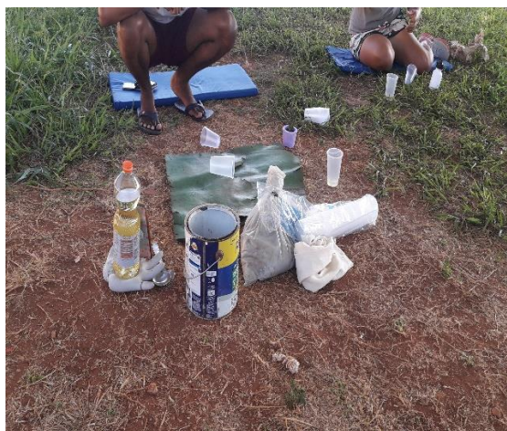
Imagens 6 e 7