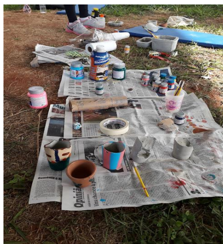
Nota: Oficina de pintura dos vasos de cimento