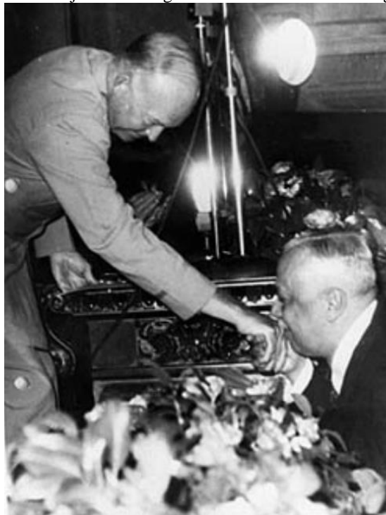
Figura 2: Otávio Mangabeira, então deputado federal pela Bahia na legenda UDN (União Democrática Nacional), ajoelha-se e beija a mão do general norte-americano Dwight Eisenhower. (1946)