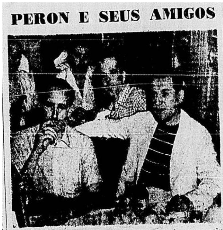
Figura 1: Perón (camisa listrada, à direita) ao lado de Rudolf Freude (charuto na mão, à esquerda). (1946)