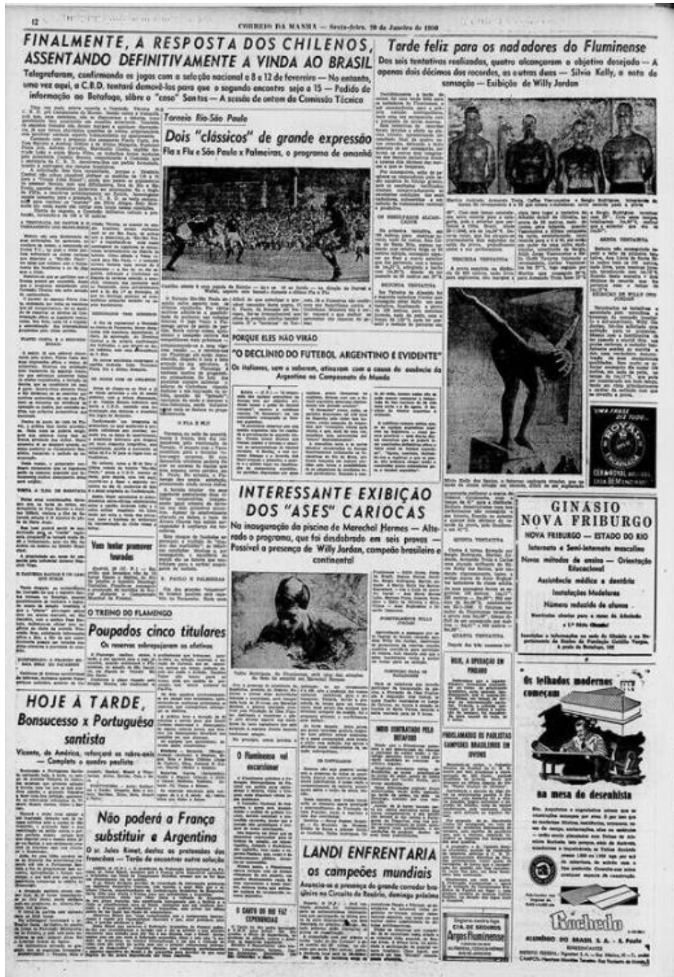
Fonte: Correio da Manhã, 20.01.1950. Disponível em: < http://memoria.bn.br/DocReader/DocReader.aspx?bib=089842_06&Pesq=argentina&pagfis=362 >. Acesso em 16.08.2022.