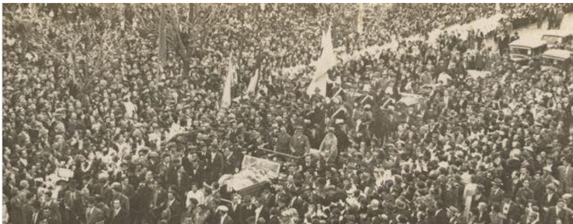
Figura 4: Multidão acompanha o carro presidencial onde estão Getúlio Vargas e Augustín Justo. (1935)