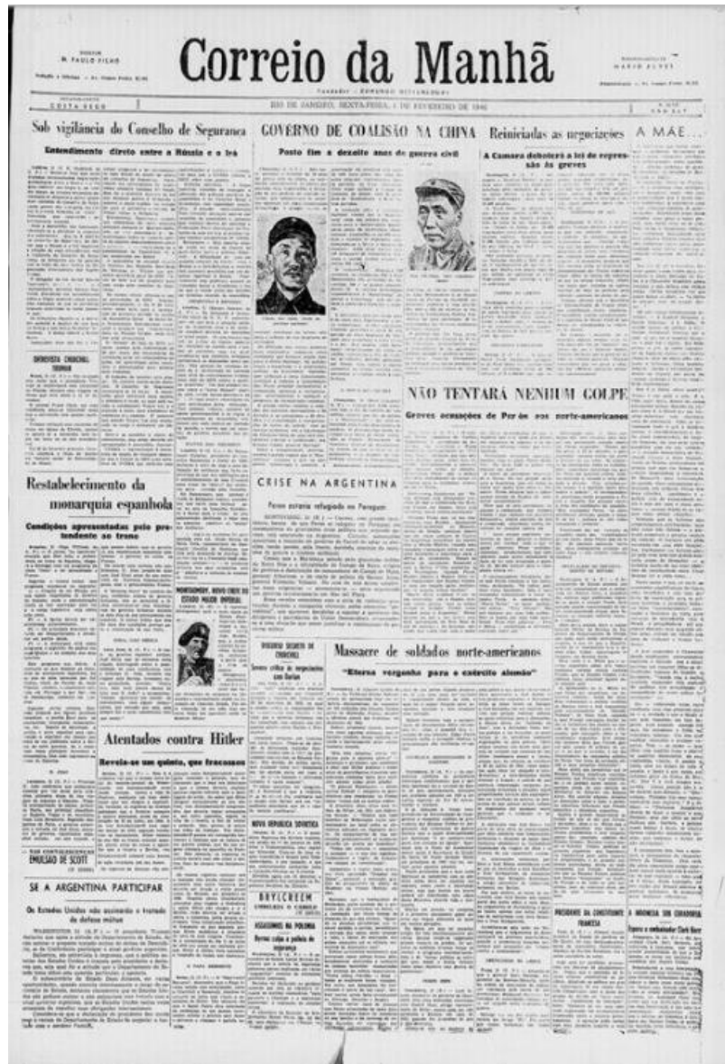
Figura 7: Correio da Manhã, folha 1 da edição de 01.02.1946. (1946)

Fonte: Correio da Manhã, 01.02.1946. Disponível em: < http://memoria.bn.br/DocReader/docreader.aspx?bib=089842_05&pasta=ano%20194&pesq=&pagfis=29853 >. Acesso em 16.08.2022.