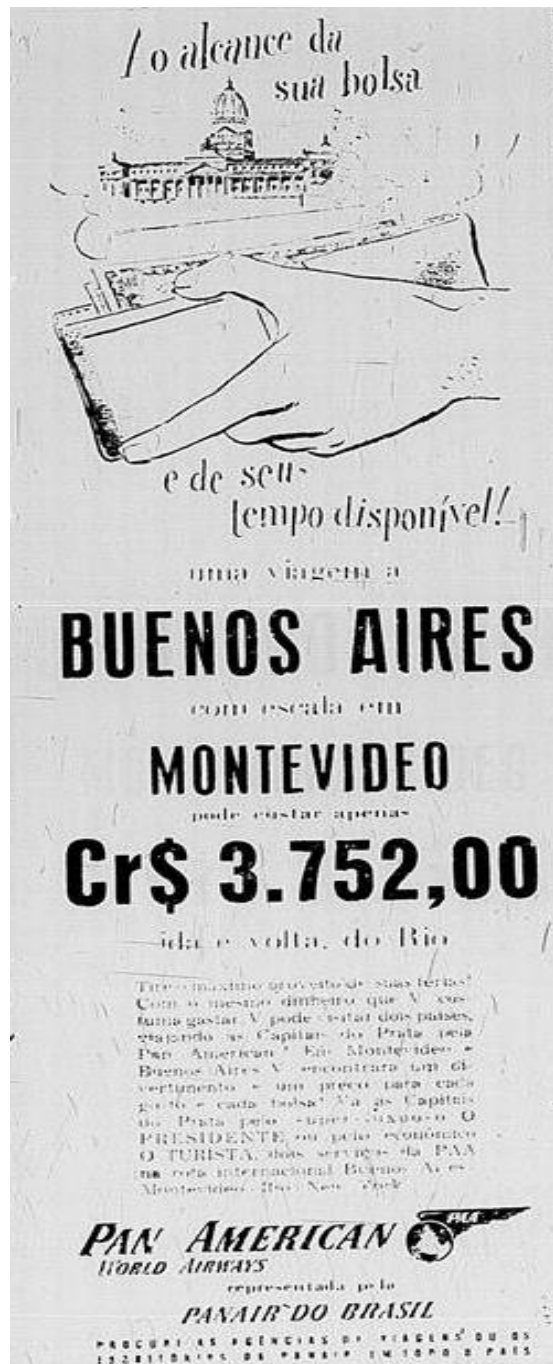
Figura 5: Anúncio de passagens para Buenos Aires. (1950)