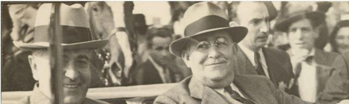
Figura 3: Getúlio Vargas e Augustín Justo em maio de 1935, em Buenos Aires. (1935)

Fonte: CPDOC, Viagens e visitas da família Vargas ao sul do país e à Argentina , < http://www.fgv.br/cpdoc/acervo/arquivo-pessoal/AVAP/audiovisual/viagens-e-visitas-da-familia-vargas-ao-sul-do-pais-e-a-argentina >. Acesso em 19.08.2022. 252