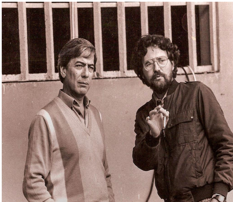
Figura 11 - Vargas Llosa e Lombardi, o escritor e o diretor acompanhando a filmagem.