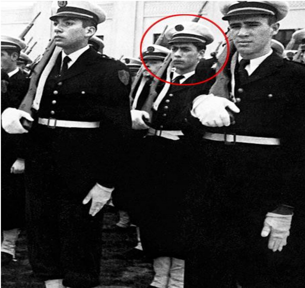
Figura 1 - O cadete Mario Vargas Llosa no desfile do Colégio Militar Leoncio Prado.