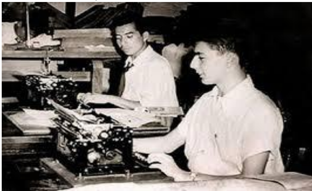
Figura 6 - Mario Vargas Llosa, com quinze anos, no seu primeiro emprego como redator no jornal La Crónica em Lima-Peru.