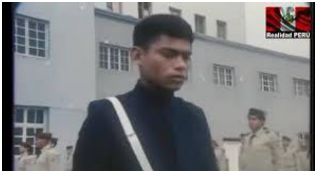
Figura 23 - Momento da expulsão do colégio do aluno Cava.