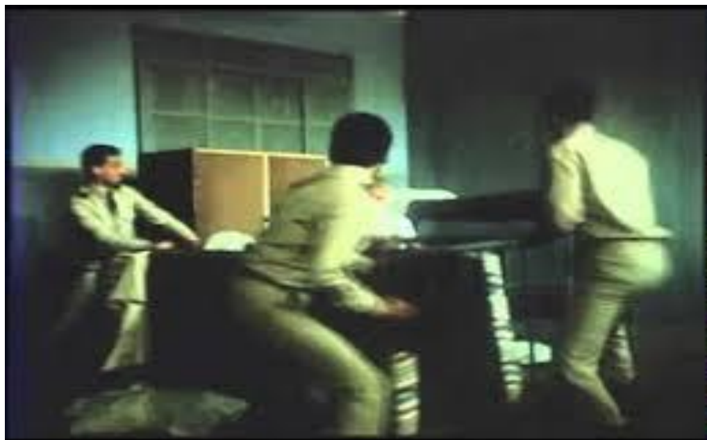
Figura 21 - Tentativas de batismo do Jaguar.

Nesse ambiente hipócrita e corrupto, todos tiveram que se adaptar às regras de sobrevivência, e o Poeta não é exceção, pois vende romances pornográficos e cartas de amor para ganhar dinheiro e fazer com que o deixem em paz. Não devemos esquecer que, apesar de sua amizade com o Escravo, ele não hesita em substituí-lo em seu relacionamento com Teresa. (CÁRDENAS, 2014, p. 68, tradução nossa ) 104