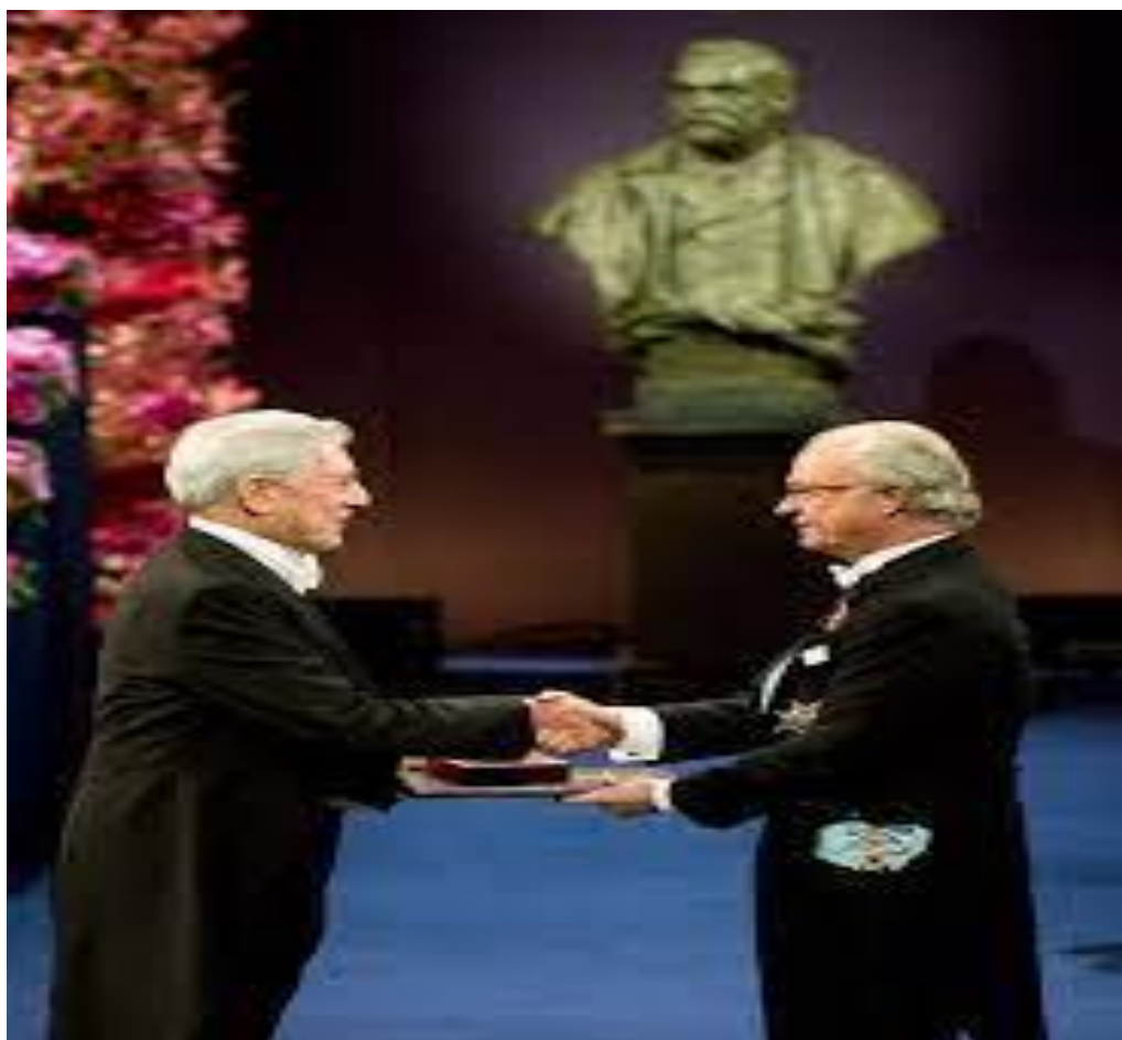
Figura 9 - Recebendo o prêmio Nobel de Literatura em 2010.