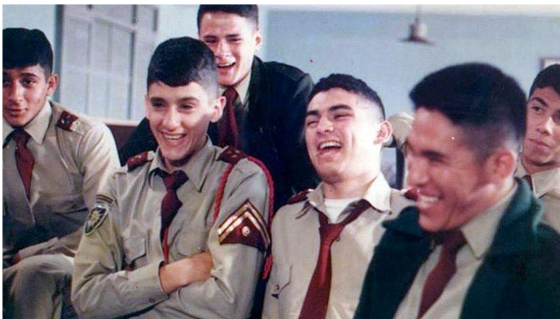
Figura 20 - Cena do filme La ciudad y los perros .

Os lugares representados dentro da instituição são cenários com pouquíssima iluminação, com luzes baixas, luzes suaves, paredes sujas e manchadas, com muita sombra sob as personagens nos momentos de escuridão quase total. Nos dormitórios, os alunos conversam baixo quando se escuta o toque de recolher. Não somente os dormitórios, corredores e banheiros são também silenciosos, além de escuros e sujos. Esses ambientes revelam hostilidade, sofrimento e incerteza.