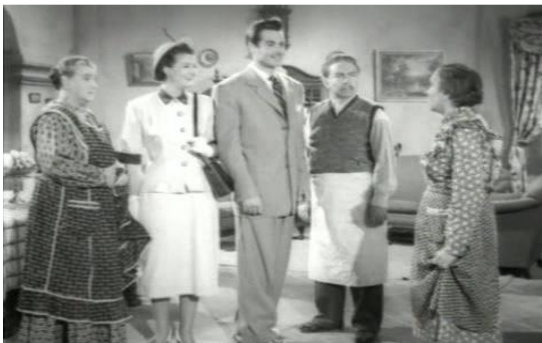
Figura 12 - Cena do filme Acá las tortas (1951).

Apresenta a vida de uma família cujo negócio é a venda de sandwiches, que graças ao trabalho árduo pode enviar seus filhos mais novos para estudar nos Estados Unidos. As crianças voltam, mas com a mentalidade mudada, desprezando tudo o que é mexicano, inclusive os sandwiches. E o irmão mais velho os devolve ao caminho da simplicidade, apesar de ser a ovelha negra da família. (Sinopsis, tradução nossa) 84