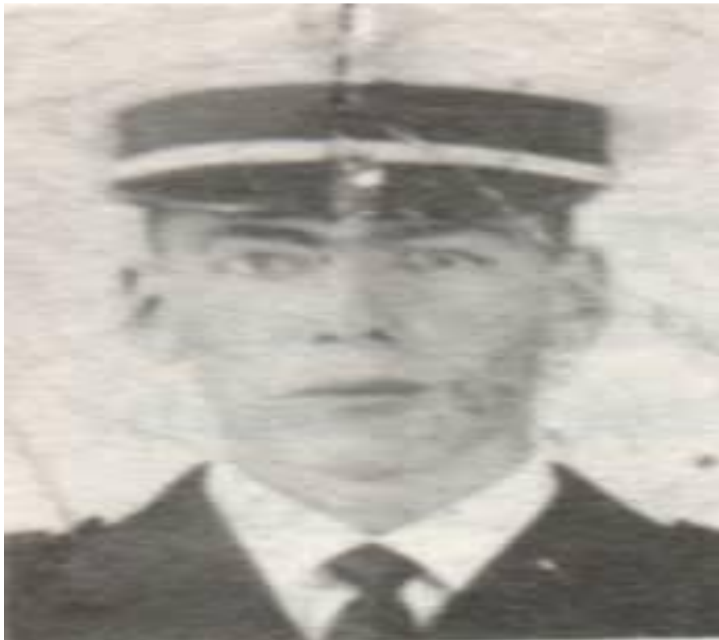
Figura 5 - Cadete Mario Vargas Llosa com a farda do Colégio Militar Leoncio Prado.

seu tempo a leituras. No entanto, o escritor pouco a pouco foi convencendo-se que as letras era o que ele mais gostava.