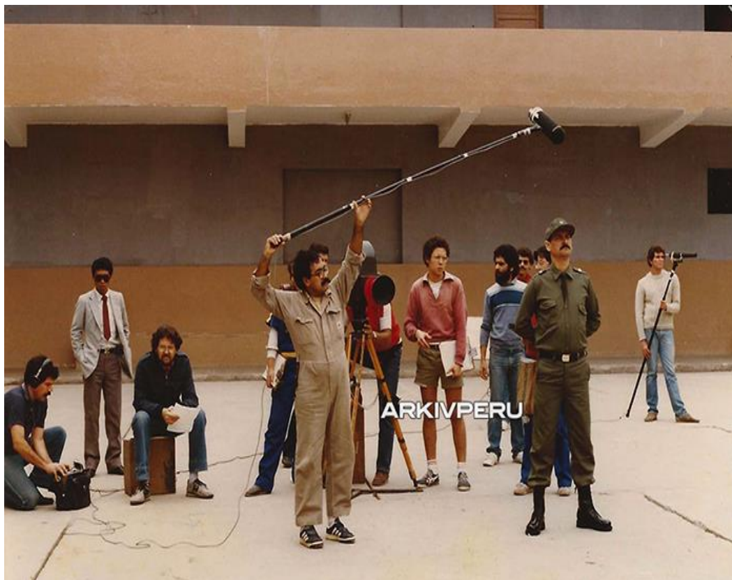
Figura 28 – Equipe de filmagem de La ciudad y los perros .