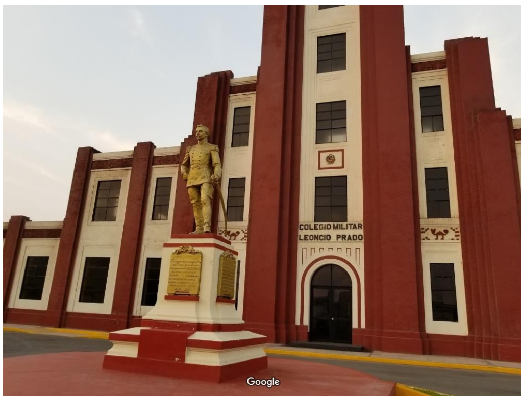
Figura 8 - Frontis do Colégio Militar Leoncio Prado, Lima-Peru.