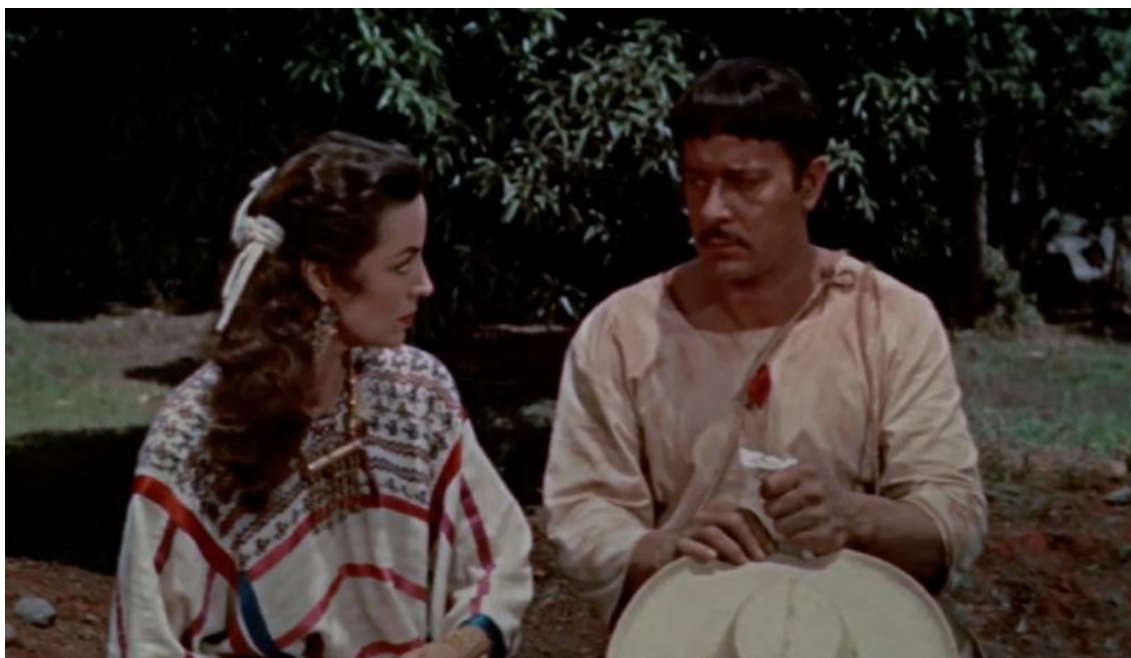
Figura 13 - O par romântico no filme Tizoc: amor índio (1957), Pedro Infante e Maria Félix.

fé católica. Destacam-se a bondade e a destreza do índio como caçador de animais pelo qual era invejado pelos outros índios da região. O cinema mexicano já filmava em cores.