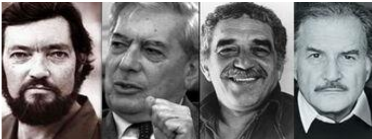
Figura 10 - Julio Cortázar, Mario Vargas Llosa, Gabriel García Márquez e Carlos Fuentes, os pilares do Boom Hispano-americano.