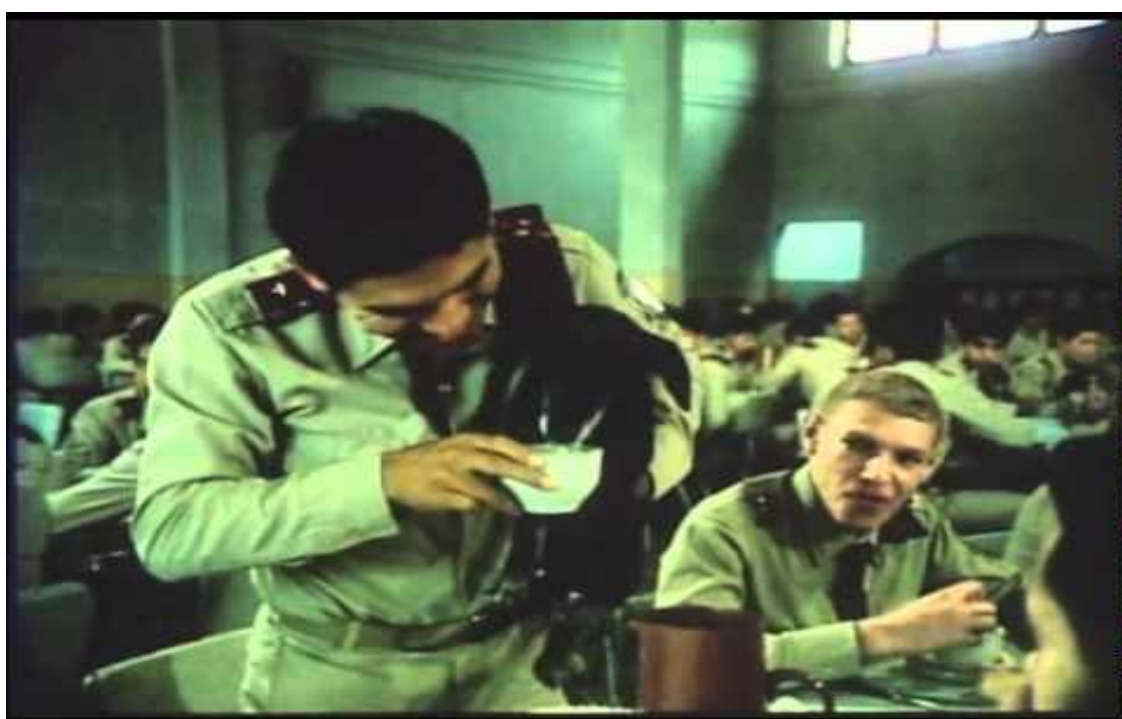
Figura 25 - Momento que a cadela “Malpapeada” bebe o leite do Esclavo no refeitório.

Assim, também o herói, com sede de justiça, faz de tudo para vingar a morte do amigo. O Poeta é a personagem que narra a história de sofrimento pela qual passam todos os alunos novatos, chamados de cachorros. Quando ingressam do batismo de fogo, muitos deles desistem do colégio. O protagonista, ainda que tenha encontrado a declaração de culpa de Jaguar, pouco ou nada pode fazer ante a morte do amigo. Todos os alunos sentem-se incapazes de ir contra as regras da instituição militar, que não admite erros nem escândalos que envolvam seus integrantes.