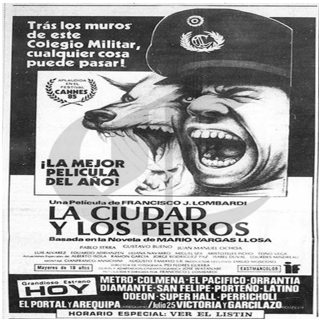
Figura 16 - Cartaz de estreia do filme La ciudad y los perros .

os três últimos anos de estudos de segundo grau. Diante desse romance de referência para o povo peruano, a notícia de uma adaptação fílmica só poderia causar grande expectativa no público, seja jovem ou adulto, leitores ou críticos literários ou de cinema. Até mesmo o público que não conhecia o romance, mas apreciava o cinema, passaria a conhecer a importante obra literária através do filme.