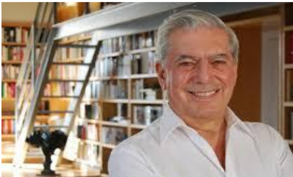
Figura 7 - Mario Vargas Llosa na biblioteca de sua casa em Lima-Peru.