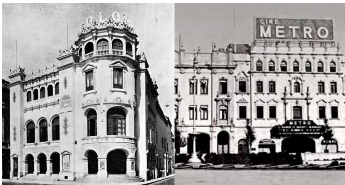
Figura 15 - Cine Colón e Cine Metro em Lima-Peru.

premiação no Festival de Moscou. Mesmo sem receber a mesma acolhida pelo público peruano, era o diretor de maior destaque que o Peru tinha desde o início do cinema. Armando Robles participou da elaboração da Lei de apoio à produção fílmica nacional no ano de 1972, um primeiro passo importante para o cinema peruano. Conforme León Frías (2015): Esta Lei [...] facilita a importação e exportação de insumos, equipamentos e material fílmico, benefícios de créditos e obrigatoriedade de exibição com o valor total de imposto [...]. (LEÓN FRÍAS, 2015, p. 32, tradução nossa) 92