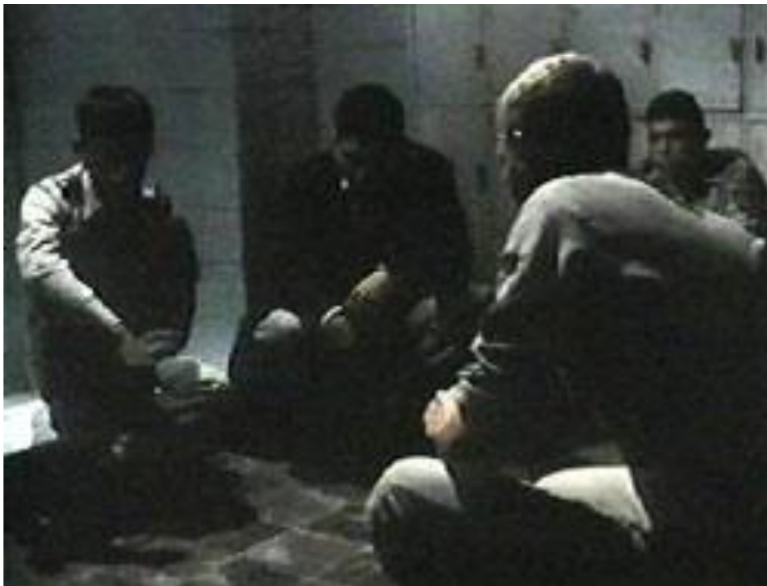
Figura 24 - Reunião do “Círculo” e o sorteio de quem vai roubar a prova de química.