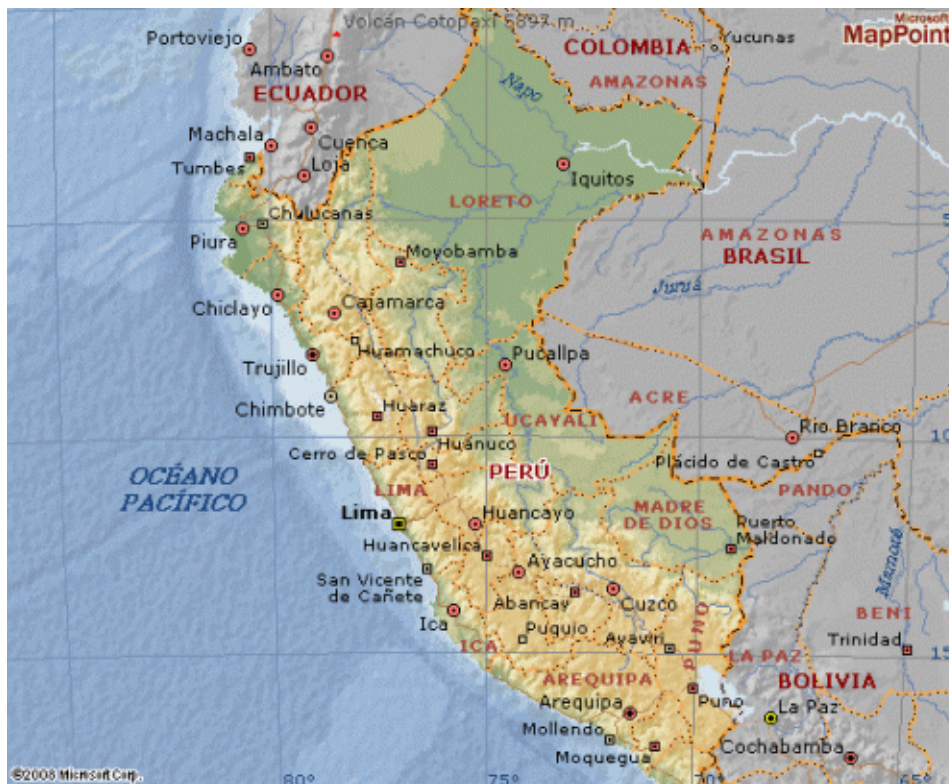
Figura 4 - Cidades nas quais morou Mario Vargas Llosa 6

São matérias-primas da sua primeira grande obra La ciudad y los perros as lembranças dos amigos do bairro de classe alta em Lima, Miraflores, com quem passava horas brincando de bola e conversando; o primeiro amor de menino por Helena e a entrada no colégio militar.