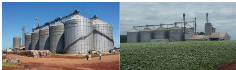
Figura 5: Estrutura física de Condomínios de soja, milho e trigo estabelecidos no Estado do Paraná

Com base nas entrevistas, constata-se que tal modelo se mostra eficiente e eficaz para a redução de gargalos logísticos, redução de custos (logísticos e de armazenagem) e se mostra viável financeiramente, bem como lucrativo para os produtores rurais envolvidos, além de apresentar inúmeras vantagens para o produtor rural e atividade agrícola, gerando competitividade ao Agronegócio Brasileiro e ganho de mercado externo.