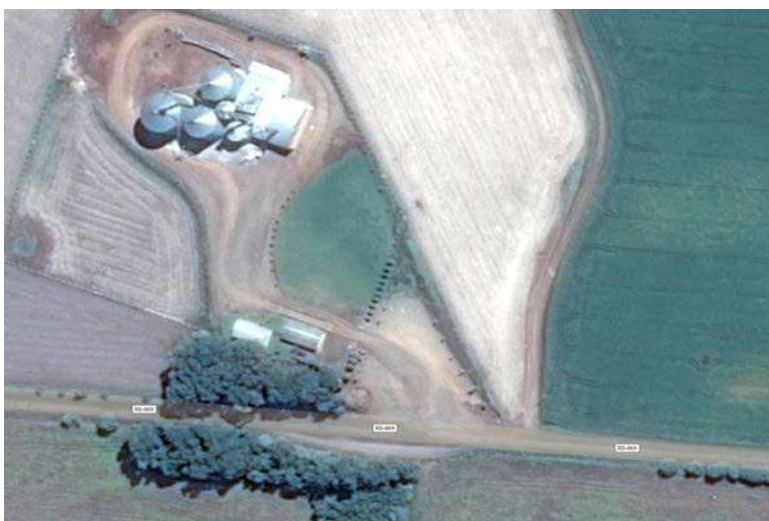
Figura 4: Imagem de Satélite de um Condomínio de Armazém Rural

De forma a ilustrar a representação de um Condomínio de Armazém Rural, é apresentada na figura 4 uma imagem de satélite do Condomínio Rural A.