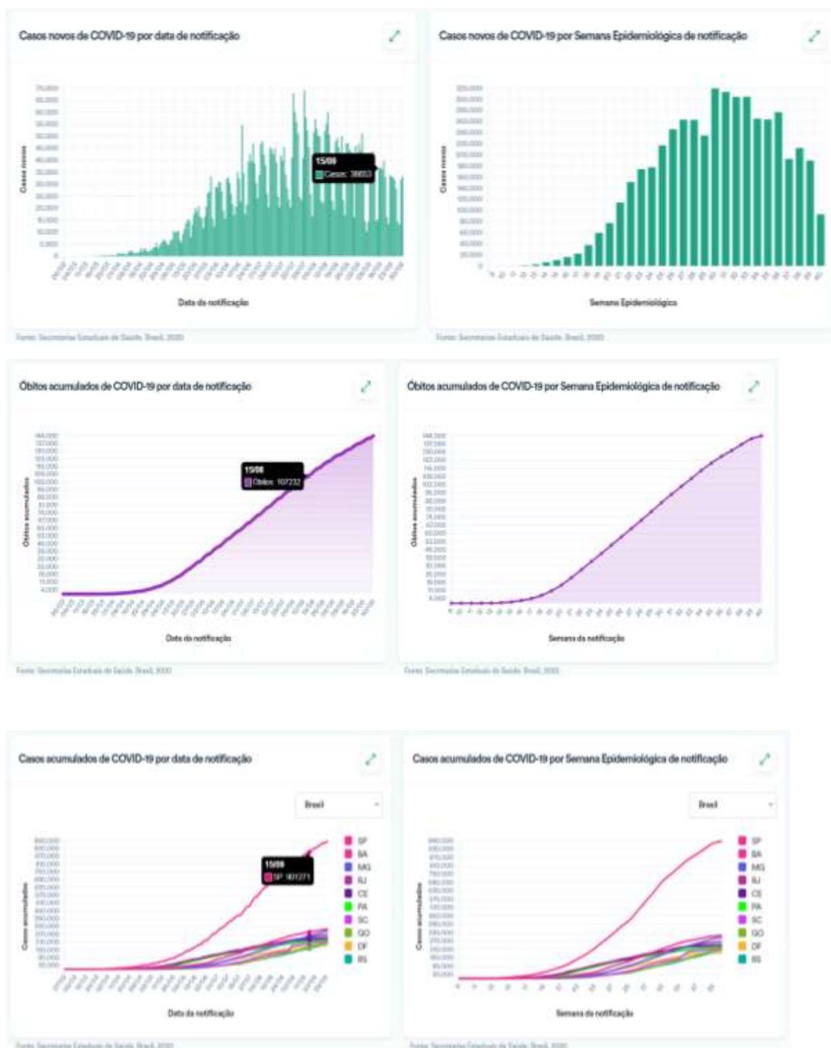
Figura 2: Visualizações de dados sobre casos e óbitos confirmados de COVID-19.