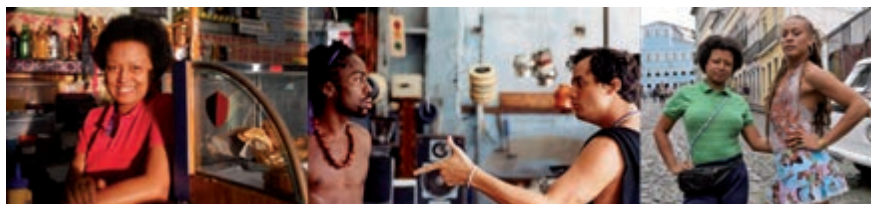
Figura 4 PERSONAGENS RESIDENTES NO PELOURINHO E SEU PAPEL NO TURISMO E NA ESPETACULARIZAÇÃO