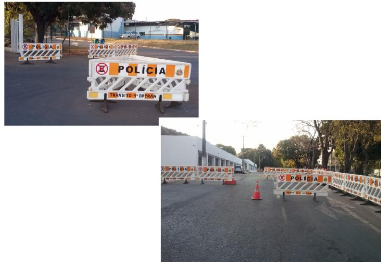
Foto 5 - Dispositivos de sinalização de trânsito da PMDF

marcadores, os gradis, enfim, qualquer aparelho de sinalização ou alerta para pedestres, motoristas e outros.