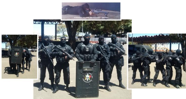
Foto 9 - Grupo de Intervenção 13 de Maio (GI-13) do Batalhão de Operações Especiais – BOpE da PMDF

Dentre alguns comandos realizados por esses toques táticos (toques de mãos nas costas ou nos ombros) podemos destacar: o avançar; o abortar; o mantenha a posição; o recuar; as incursões em deslocamento à direita ou à esquerda; o acesso disponível (aberto) ou indisponível (fechado) e outros . Por fazer parte da percepção mínima do ser humano, essa leitura tateável (contato de mão) necessita de certa proximidade ao elemento passivo de leitura.