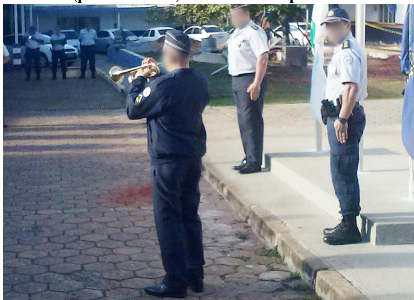
Foto 7 - Corneteiro (policial militar) em formatura policial militar - PMDF