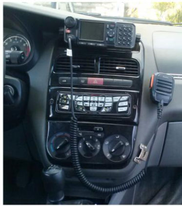
RÁDIO VEICULAR FIXO