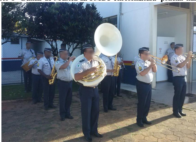
Foto 8 - Banda de Música da PMDF em formatura policial militar

Nota-se também como meio utilizado de marcação de passos para ordenação de uma melhor cadência por parte dos policiais militares, as salvas de palmas utilizadas nas corridas desses policiais militares em seus respectivos treinamentos físicos. De outro modo, pode-se considerar como comunicação tática sonora, a salva de gala, que são tiros de armas realizados em honras militares, e também em marchas fúnebres.