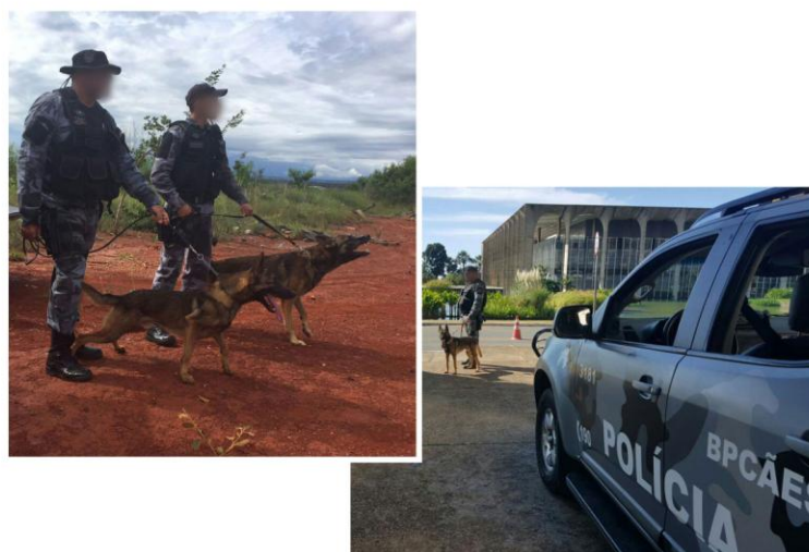
Foto 10 - Operação policial do Batalhão de Policiamento com Cães – BPCães da PMDF