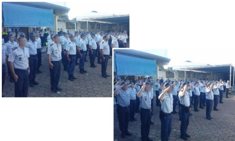
Foto 3 – Formatura policial militar em início de expediente - PMDF