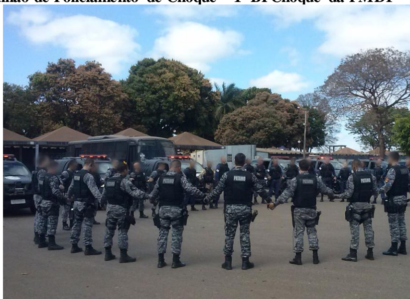
Foto 2 – Agrupamento preliminar informal para entrada em serviço do 1º Batalhão de Policiamento de Choque - 1º BPChoque da PMDF

Nas grandes manifestações públicas os comandantes dos pelotões de choque podem usar, dependendo do contexto, o comando à tropa, através de acenos ou gestos braçais informando assim, as formações dos respectivos pelotões, se é em linha, cunha, ou losango, bem como se é ofensiva, defensiva ou em outras formações táticas, ou seja, informando qual a formação para melhor dispersar ou conter a multidão de acordo com a visão deles. Entretanto, dependendo da situação encontrada, os comandantes das ações táticas podem se posicionar atrás da linha de frente para ordenação às tropas, entretanto, usando o comando de voz, e não a linguagem tática não verbal.