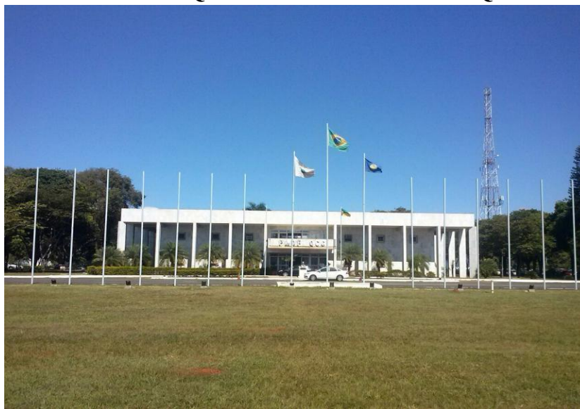
Foto 6 – Bandeiras hasteadas - Quartel do Comando Geral – QCG da PMDF