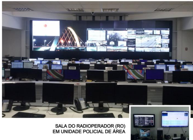
SALA DO RADIOOPERADOR (RO) EM UNIDADE POLICIAL DE ÁREA