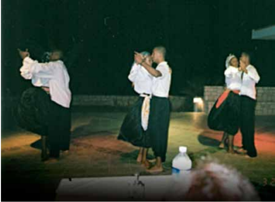
Apresentação de noite cabo-verdiana no Hotel Marine Club

As imagens do exótico e do paradisíaco são fartamente exploradas no trecho que abre este item, escrito por Germano Lima, intelectual cabo-verdiano nascido em Boa Vista. No texto publicado na revista de bordo da TACV, ele realiza uma analogia entre a ilha e uma virgem que aguarda e se oferece ao príncipe encantado. A natureza paradisíaca e exótica parece guardar continuidade com o feminino à espera do explorador, do turista – continuidade explorada aqui também na relação entre jovens locais e os turistas com quem se relacionam. A categoria amigo, também amplamente utilizada para tratar da relação entre turistas e os locais, parece sintetizar o que o visitante imagina encontrar: uma simpatia genuína e uma “amizade natural das pessoas” em continuidade com a natureza paradisíaca do lugar. 19