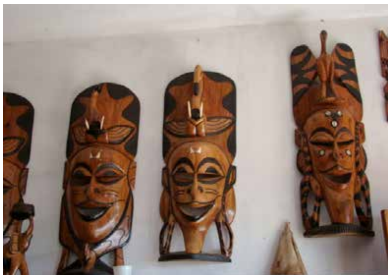
Barraca com artesanato africano