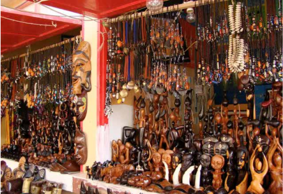
Barraca com artesanato africano