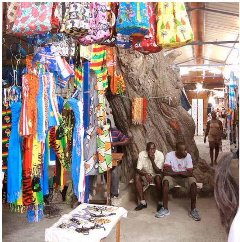
Barraca de guineenses no Mercado de Sucupira, Cidade da Praia