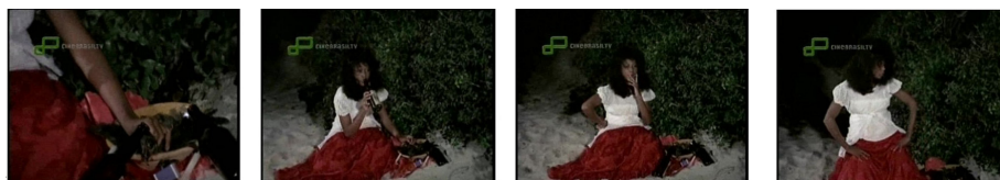
Fig. 2. Anésia e referência à Pombagira

Embora não esteja diretamente relacionada à sacerdotisa analisada, vale ressaltar uma passagem em que Anésia faz um despacho, com o objetivo de conquistar o amor de Chico. Alguns elementos que compõe essa oferenda (bebida alcóolica e cigarro), o ritmo percussivo da trilha sonora, o uso da cor vermelha no figurino e a gestualidade empregada pela personagem em tal sequência (Figura 2), podem ser considerados uma alusão à Pombagira.