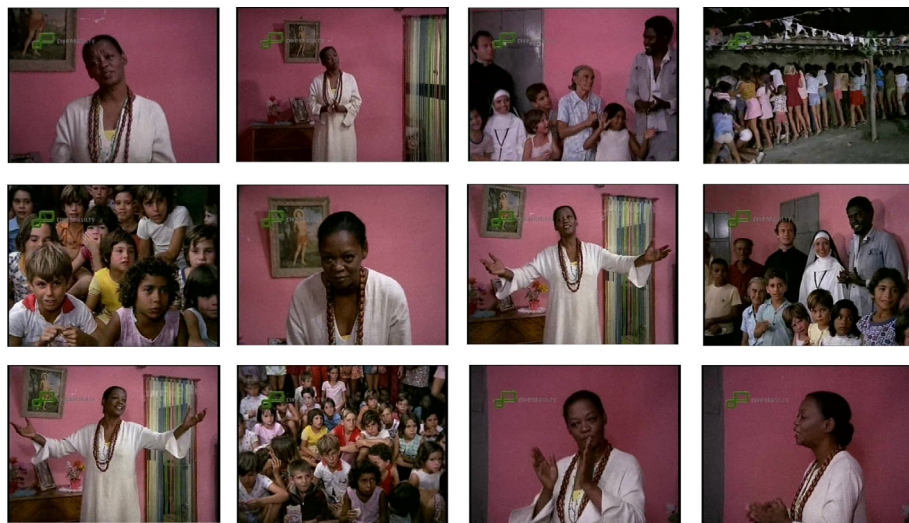
Fig. 1. Festa de Cosme e Damião na casa de Mãe

Um dos momentos mais significativos da atuação de Mãe Cotinha é a festa que ela oferece para São Cosme e São Damião (Figura 1), na qual aparece centralizada no enquadramento, e de maneira imponente canta um ponto de Umbanda para aqueles que participam do louvor às divindades infantis católicas, também reverenciadas nos cultos afro-brasileiros.