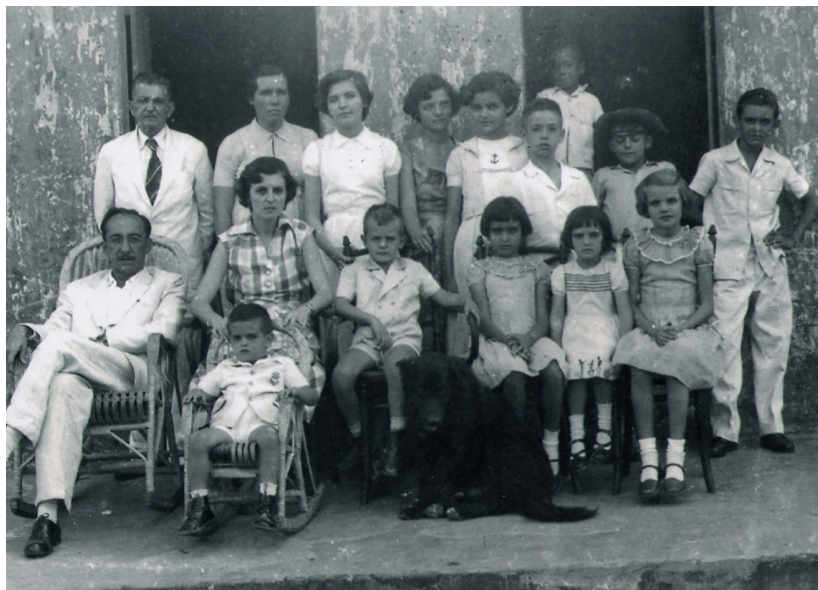
Foto original: Família de proprietários de terra em Pedra Branca - Ceará/Brasil, 1951