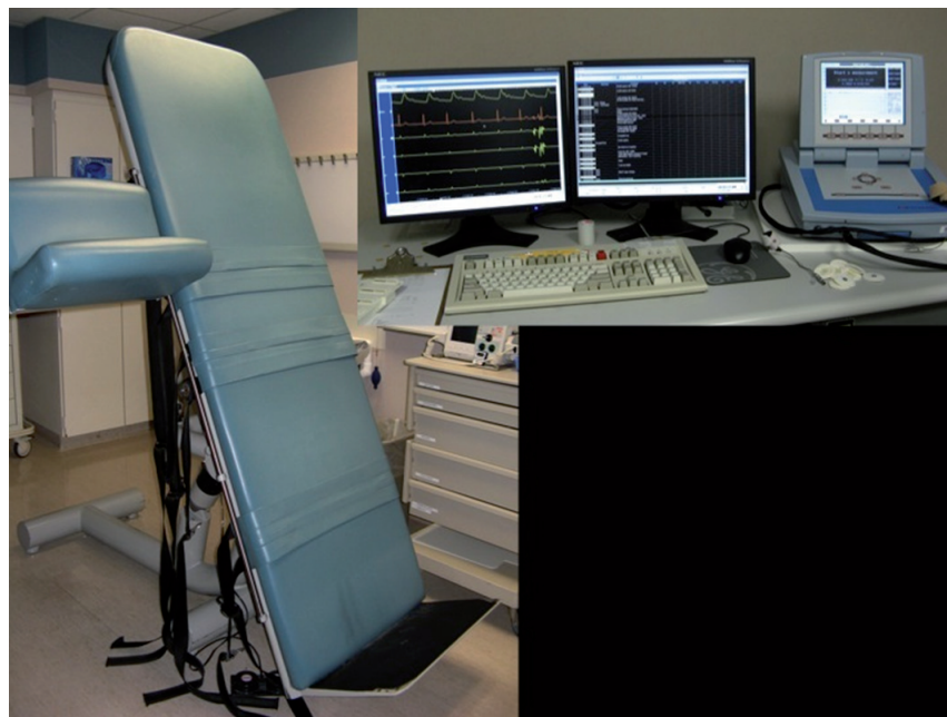
Fig. 1 - Mesa inclinada a 70 graus com suporte para os pés e para o membro superior em que a PA será aferida. As faixas de velcro permitem a contenção do paciente em caso de perda do tônus postural. Os equipamentos necessários são (da direita para esquerda): aparelho de monitorização não invasiva da PA batimento a batimento e monitores para visualização do ECG e curva de PA.