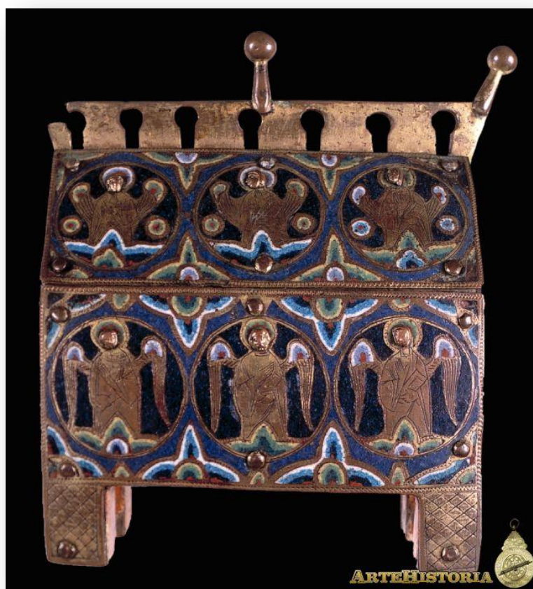
Figura 8 – Arqueta relicário do mosteiro de Sandoval (séc. XIII)

Note-se que a arca em si, localizada na igreja, já causava impacto, além de anunciar seu conteúdo, sobretudo no que se referia à vida de Cristo. Havia ainda