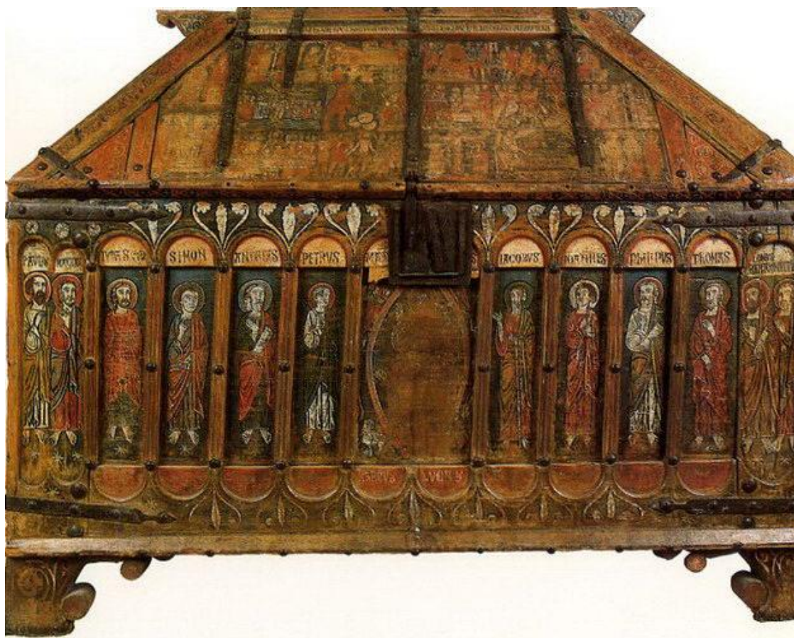
Figura 7 – Arca das relíquias de Carrizo (séc. XII)

Devido ao elevado número, aventa-se a possibilidade de que as relíquias não estivessem todas expostas, mas que fossem exibidas quando a ocasião o requeresse, inclusive, de forma a valorizar suas características de tesouro. Carrizo, por exemplo, possuía uma arca das relíquias, que se situava sob o altar-mor, e que hoje se encontra no Museu Diocesano de Astorga.