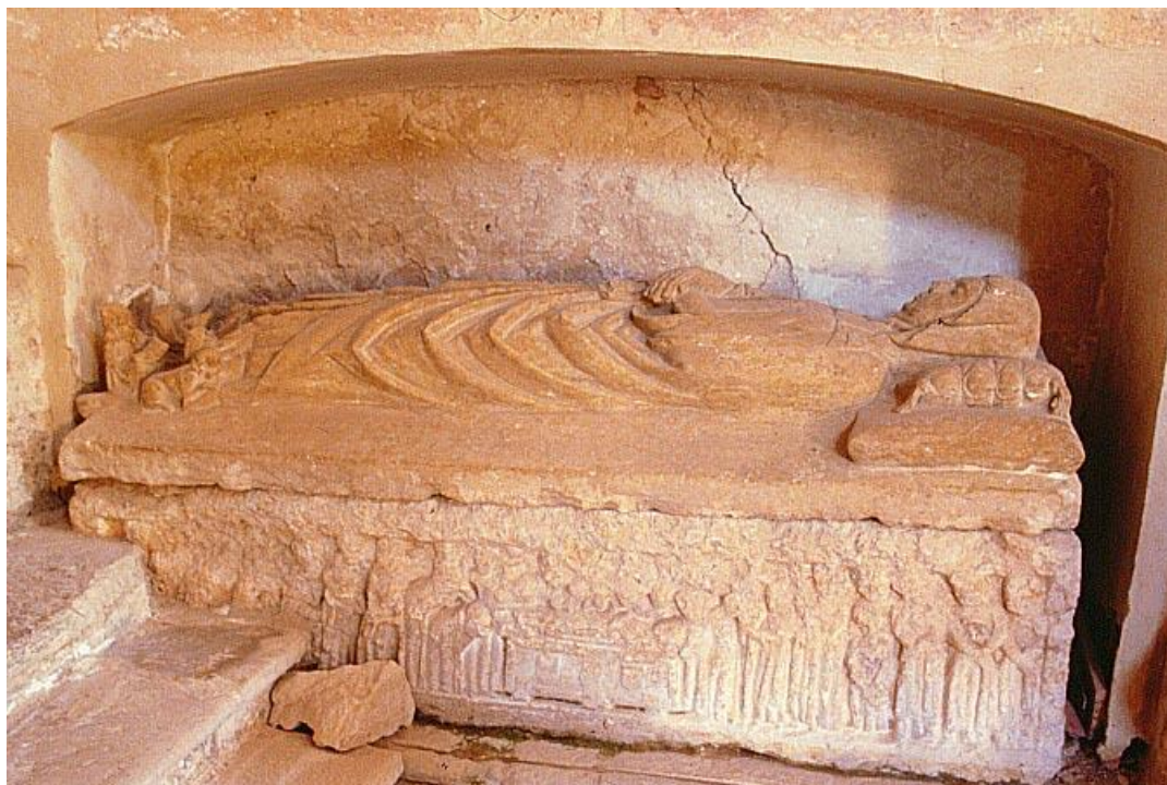
Figura 5 – Túmulo de Estefanía Ramírez