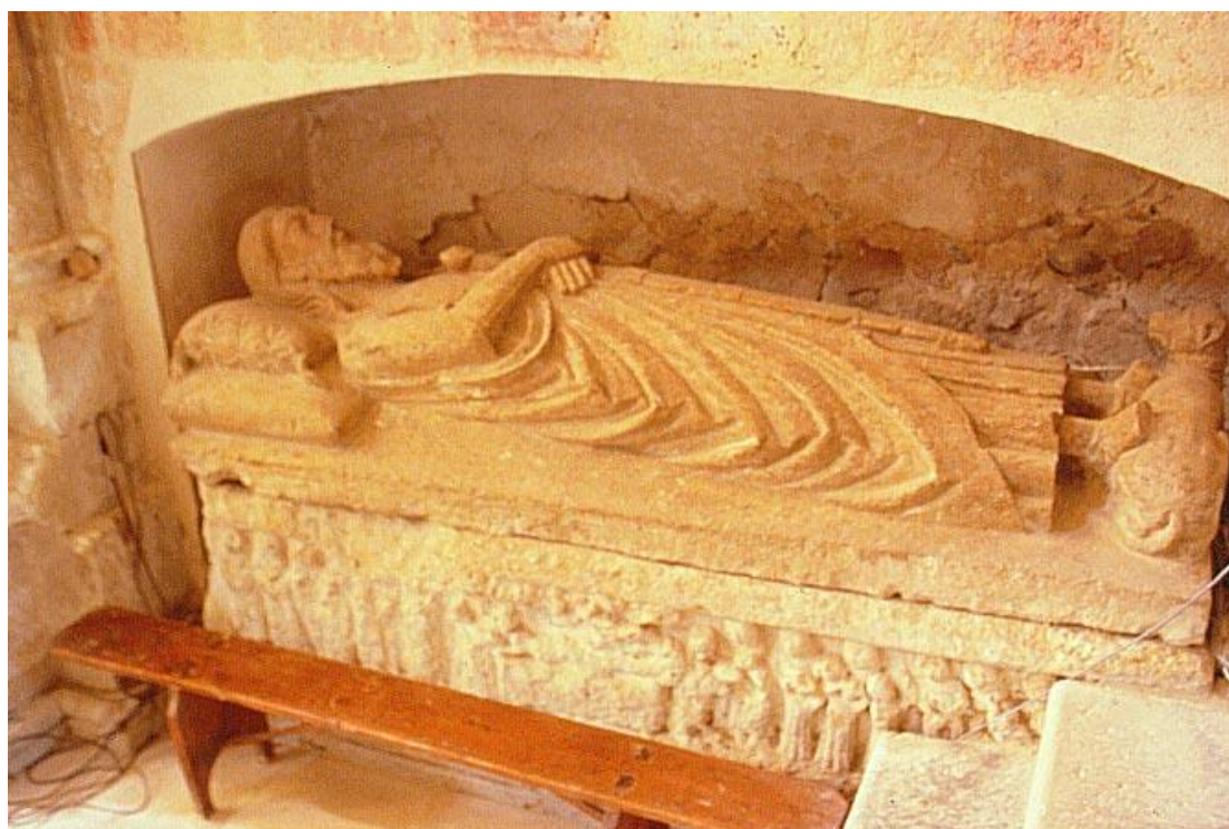
Figura 4 – Túmulo de Ponce de Minerva

O mosteiro de Sandoval foi fundado pelos condes Ponce de Minerva e Estefanía Ramírez, a mesma responsável pela fundação de Carrizo. Na igreja encontram-se os túmulos do casal, reproduzidos a seguir.