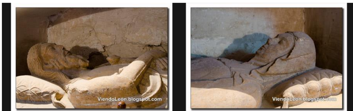
Figura 6 – Detalhe dos túmulos de Ponce de Minerva e de Estefanía Ramírez