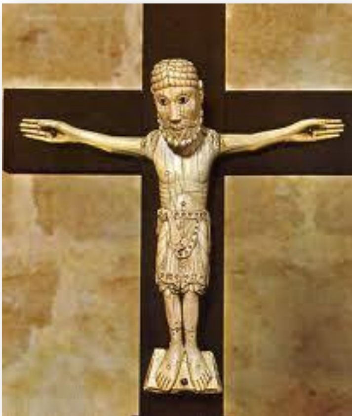
Figura 10 – Cristo de Carrizo (séc. XI)