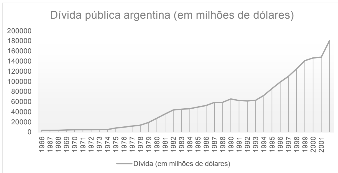
Gráfico 1 – Dívida pública argentina (em milhões de dólares).

É nesse momento que países como a Argentina iniciam uma espiral sem precedentes de endividamento, cuja dimensão pode ser verificada no seguinte gráfico, a ilustrar que uma dívida daquele país, que, em 1974, correspondia a pouco mais de 5 bilhões de dólares, multiplicou-se por nove no período de dez anos: