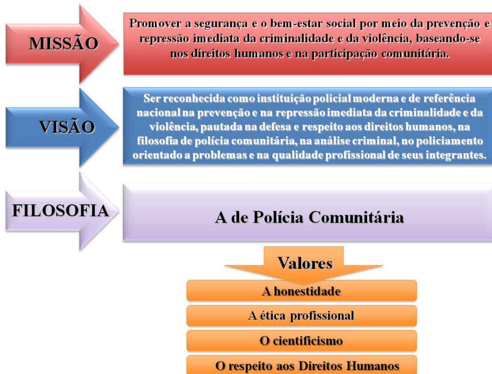
Figura 3: Missão, visão, filosofia e valores da PMDF.

Definidas no Planejamento Estratégico da PMDF (2011) em vigor na corporação estão a missão, visão, filosofia e os valores organizacionais, conforme figura 3 a seguir: