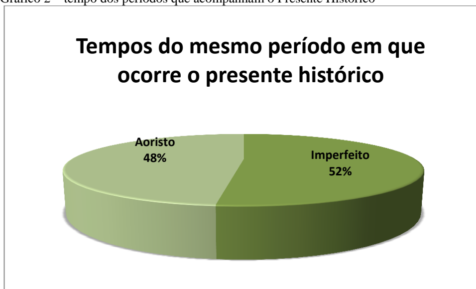
Gráfico 2 – tempo dos períodos que acompanham o Presente Histórico

Possivelmente, isto ocorre porque, nos textos de Andócides, o Presente histórico está inserido em períodos construídos com o tempo Imperfeito quase que na mesma proporção que em períodos construídos com o Aoristo. Segue a porcentagem expressa no Gráfico 2: