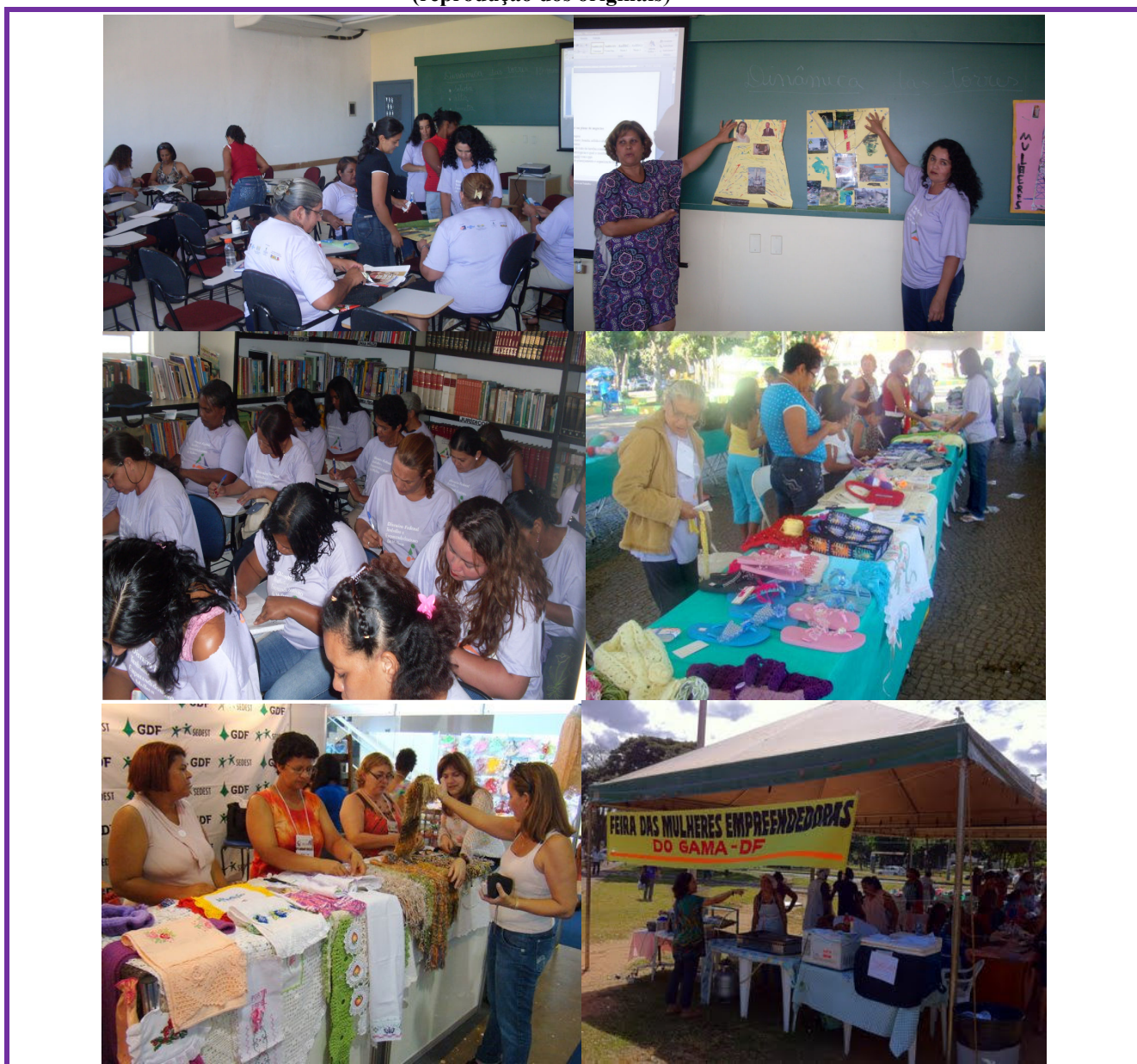
Figura nº 6 - Turmas dos cursos BPW (reprodução dos originais)

Fonte: Sítios da SEDEST e do PTEM; Blog “Por um lugar melhor”/ Feira das mulheres empreendedoras do Gama 23