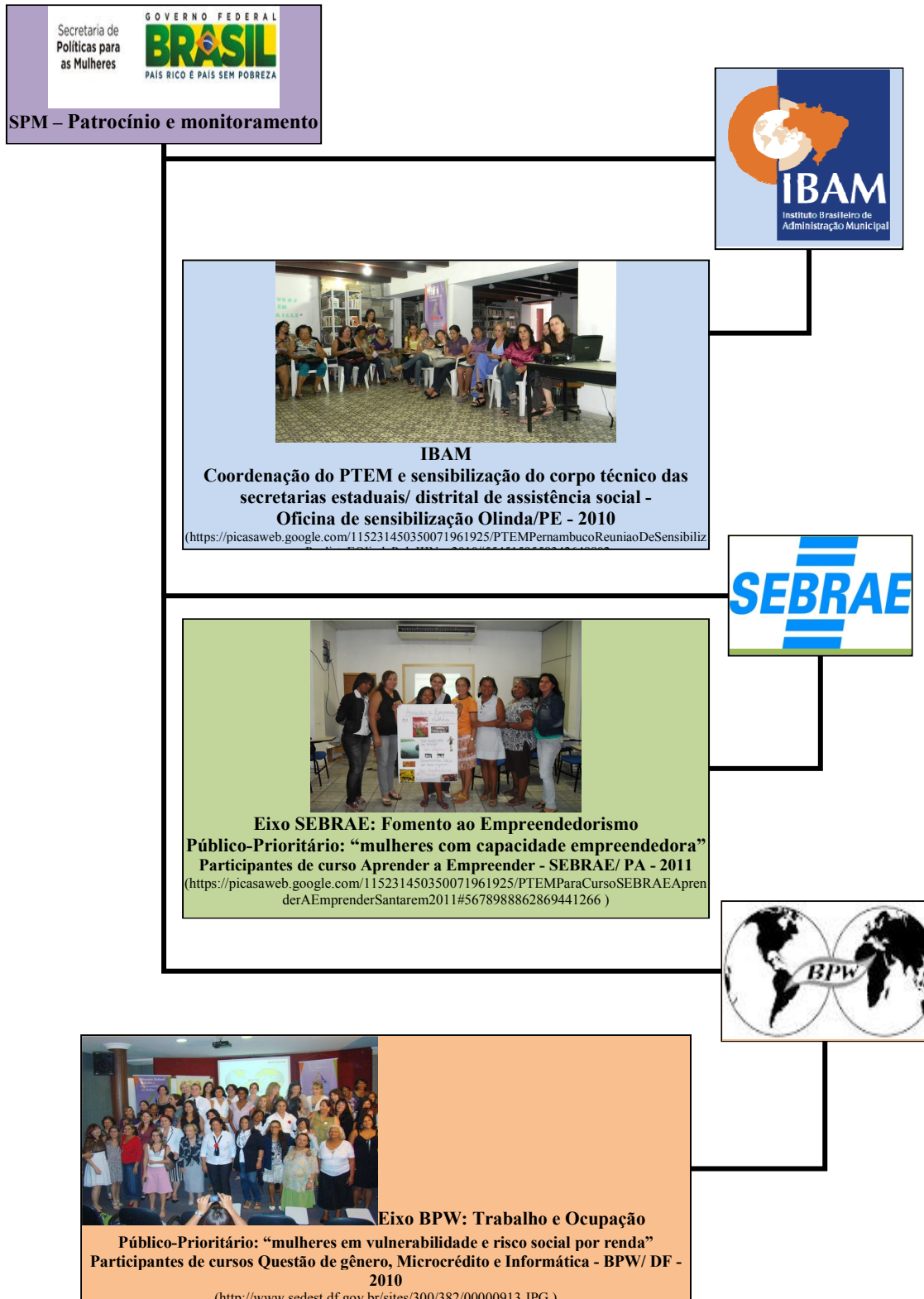
Figura nº 11 Organograma PTEM – Estrutura Nacional