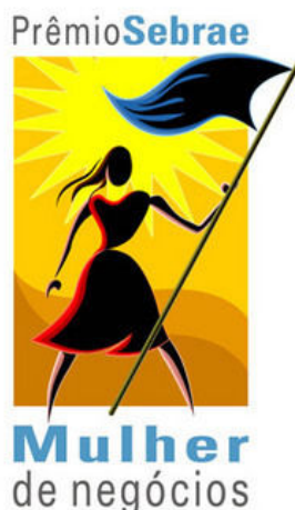
Figura 7 - Publicidade SEBRAE 19