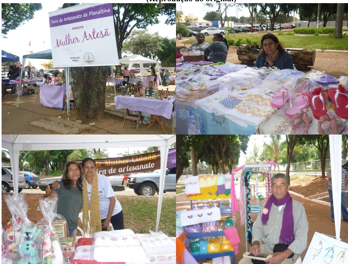
Figura nº 8 – Projeto Mulher Artesã em Planaltina – DF (Reprodução do original)