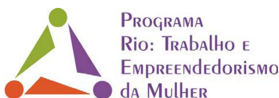
Figura nº2 - logomarca (reprodução do original)