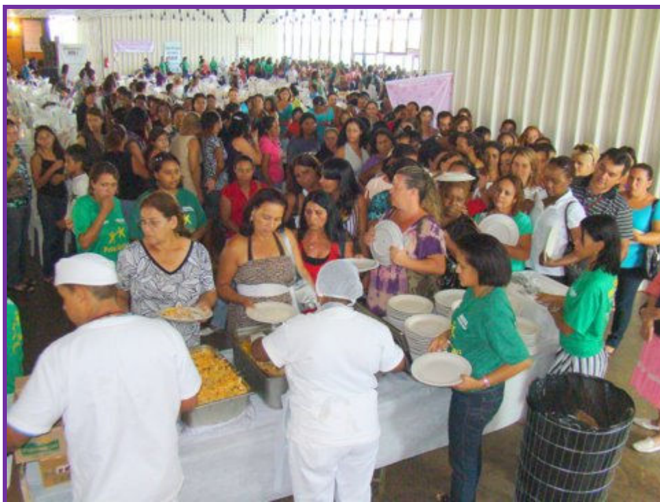
Figura nº5 Lançamento do Com Licença, Eu Vou à Luta no Dia Internacional da Mulher de 2010.

Fonte: Sítio da SEDEST (disponível em http://www.sedest.df.gov.br/sites/300/382/00001118.JPG ) (reprodução do original)