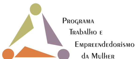
Figura nº 3 - logomarca do Programa (reprodução do original)

Em 2008, o Programa Trabalho e Empreendedorismo da Mulher (PTEM) tornou-se uma política nacional, ampliando as metas constantes do capítulo “Autonomia econômica e igualdade no mundo do trabalho, com inclusão social” do II PNPM (SPM, 2009). Nas publicações da época, o objetivo do Programa conta com mais de uma versão oficial igualmente válidas: