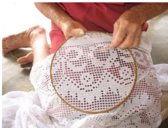
Figura nº 9 - Bordado de Labirinto 1