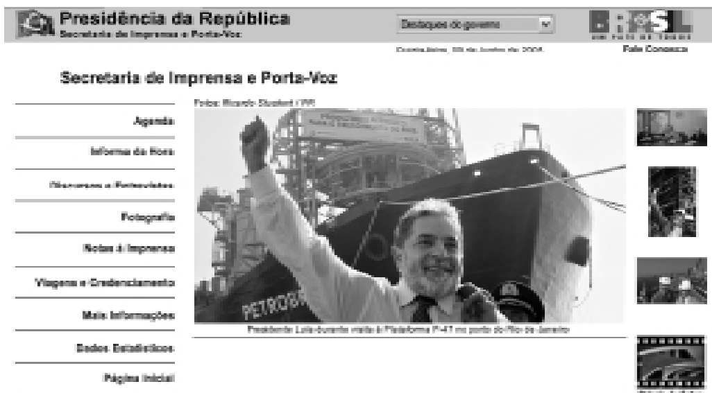
Figura 2: Site da Secretaria de Imprensa e Divulgação ( www.info.planalto.gov.br )

Lido o tempo todo com o que essas pessoas escrevem, analiso este trabalho, tenho uma atuação junto aos jornalistas no sentido de ajudá-los a ter elementos para escrever (...) Mas muitas vezes falta essa compreensão no nível da prática, de dar a esse correspondente um atendimento rápido, compreendendo as necessidades dele em termos de deadline , em termos de extensão do assunto, em termos de citação de fontes, que é uma característica da imprensa estrangeira (...). Então a gente tem que estar sempre trabalhando de forma a suprir esses jornalistas