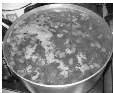
Figura 3 - Recipiente contendo pedaços de cacto em água natural, após 2 dias de repouso