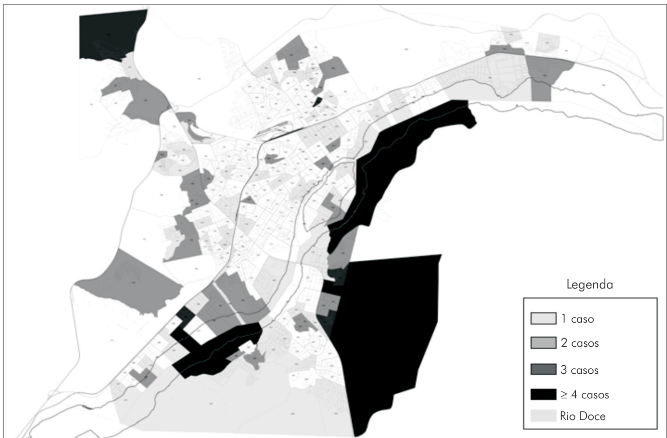
Los tonos de gris varían de acuerdo con la frecuencia de casos de LTA en los sectores: (□) Uno casos/sector, (■) dos casos/sector, (■) tres casos/sector, y (■) ≥ cuatro casos/sector. El área colorida (□) representa a Rio Doce.

La figura 2 muestra los sectores censitarios (n = 253) del área urbana de Governador Valadares en tonos de gris de acuerdo al número de casos, permitiendo la identificación de áreas en donde se concentraron las ocurrencias de LTA. El análisis de agrupamientos de los resultados permitió la clasificación de estos sectores censitarios en tres grupos, como mostrado en la figura 3. La mayor prevalencia de la LTA se verificó en el III (15,99 por 100 mil habitantes), seguido del grupo II (15,10 por 100 mil habitantes), mientras que el grupo I presentó la menor prevalencia (11,38 por 100 mil habitantes). Las frecuencias absoluta y relativa de LTA en estos locales se presentan en la tabla 3.