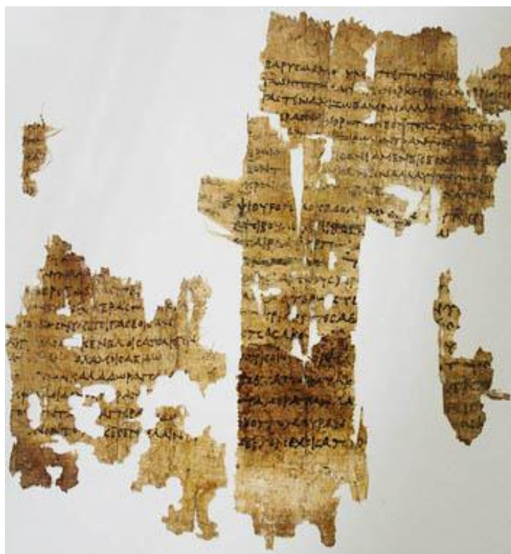
Figura 2 - Fragmento da poesia de Safo 31

A poesia, que afetou consideravelmente a vida política, teve Safo como representante feminina. Conforme aponta Glenn Most 32 , Safo, por comportar figuras. Existiria, então, uma