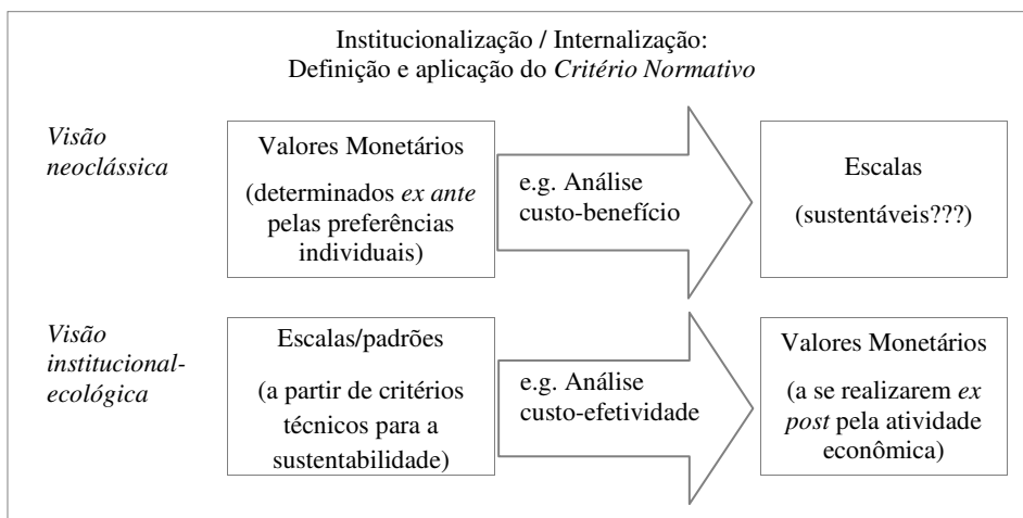
Figura 1 Valores Ambientais Ex ante e Ex post nas visões Neoclássica e Institucional-ecológica

Façamos aqui ainda uma observação. Poderia neste ponto ser contra-argumentado, em defesa da visão neoclássica, que tal entendimento não seria correto, que os indivíduos também formam suas preferências a partir de critérios de sustentabilidade que lhes seja(m) conhecido(s). De fato, Milon (1995), por exemplo, discute como diferentes critérios de sustentabilidade – seja a neoclássica (Solow), seja a ecológica (Holling) 8 – gerarão diferentes estruturas de Valores Econômicos Totais pelos indivíduos. Assim, poder-se-ia, do ponto de vista neoclássico, argumentar que, do mesmo modo como na visão institucionalista as instituições utilizam-se do máximo de informação técnico-científica biofísico-ecológica ex ante e que com isso irão gerar seus valores (instrumentais) ex post , na visão neoclássica são os indivíduos que se utilizam do máximo de informação técnico-científica biofísico-ecológica ex ante e que com isso irão gerar seus