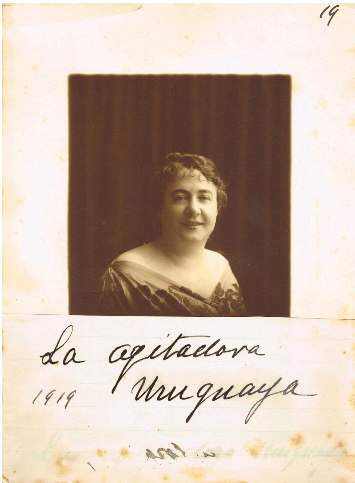
Paulina Luisi, 1919