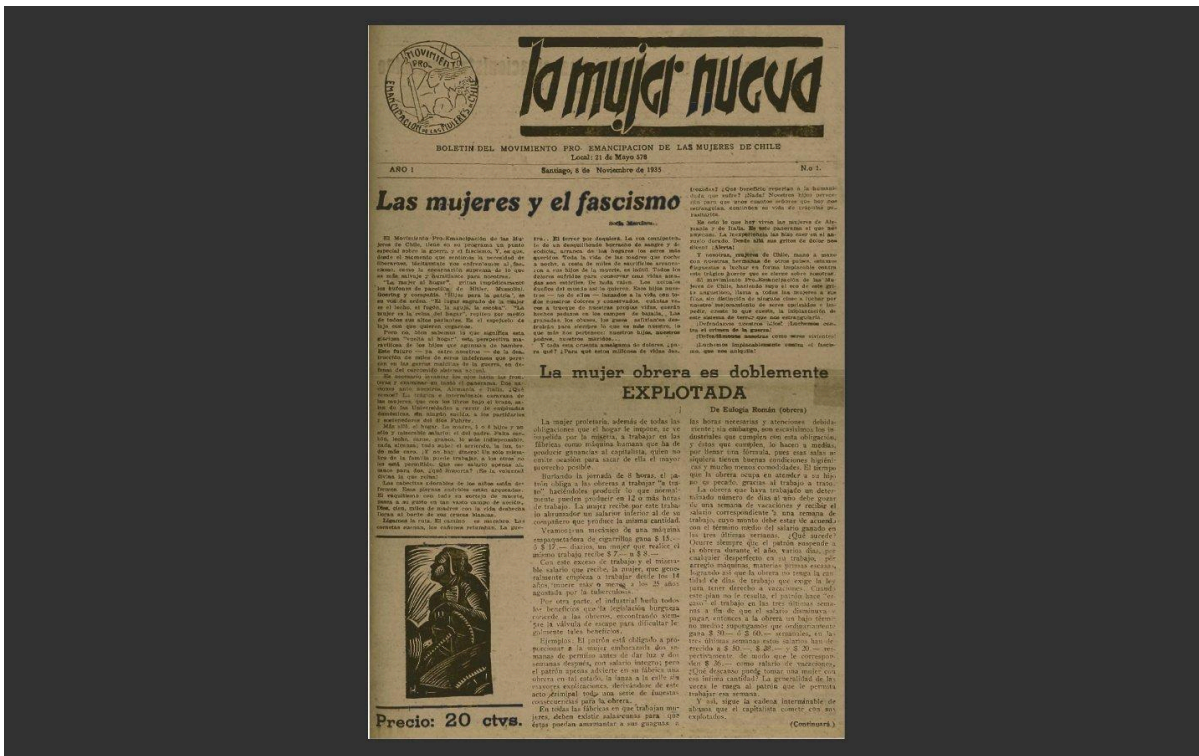
Jornal La Mujer Nueva (1935)