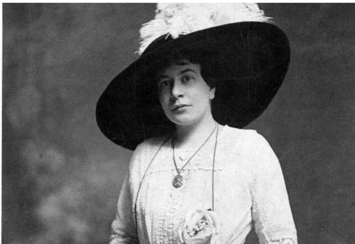
Paulina Luisi, década de 1910