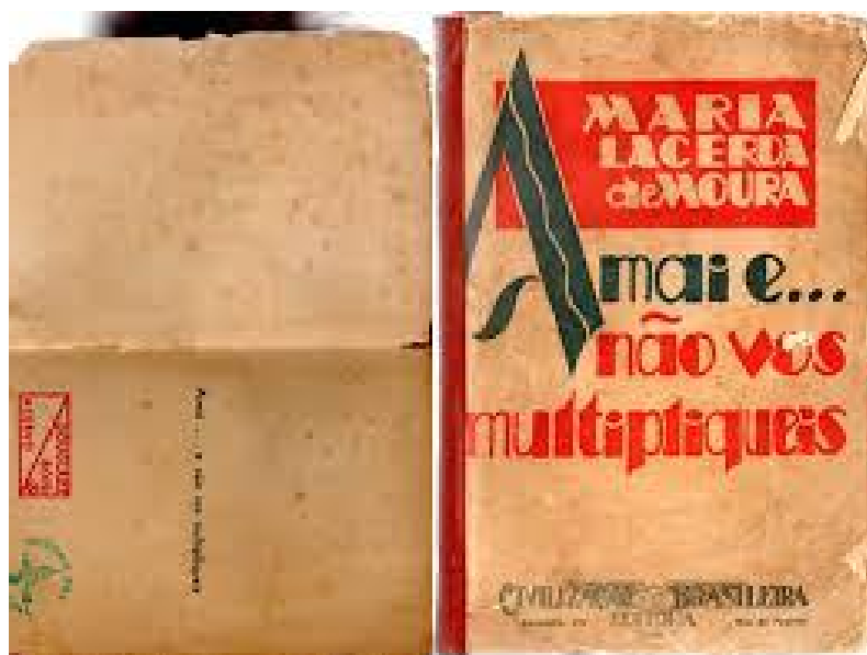
Capa do livro Amai e... não vos multipliqueis de Maria Lacerda de Moura, 1932