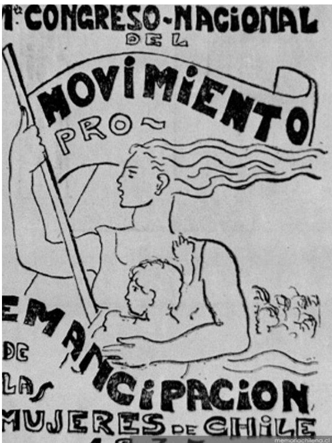
Cartaz do MEMCh (1937)