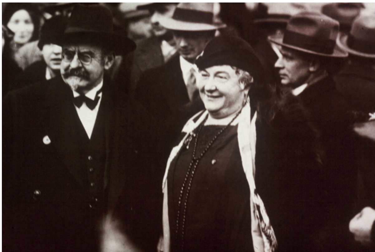
Paulina Luisi, década de 1940