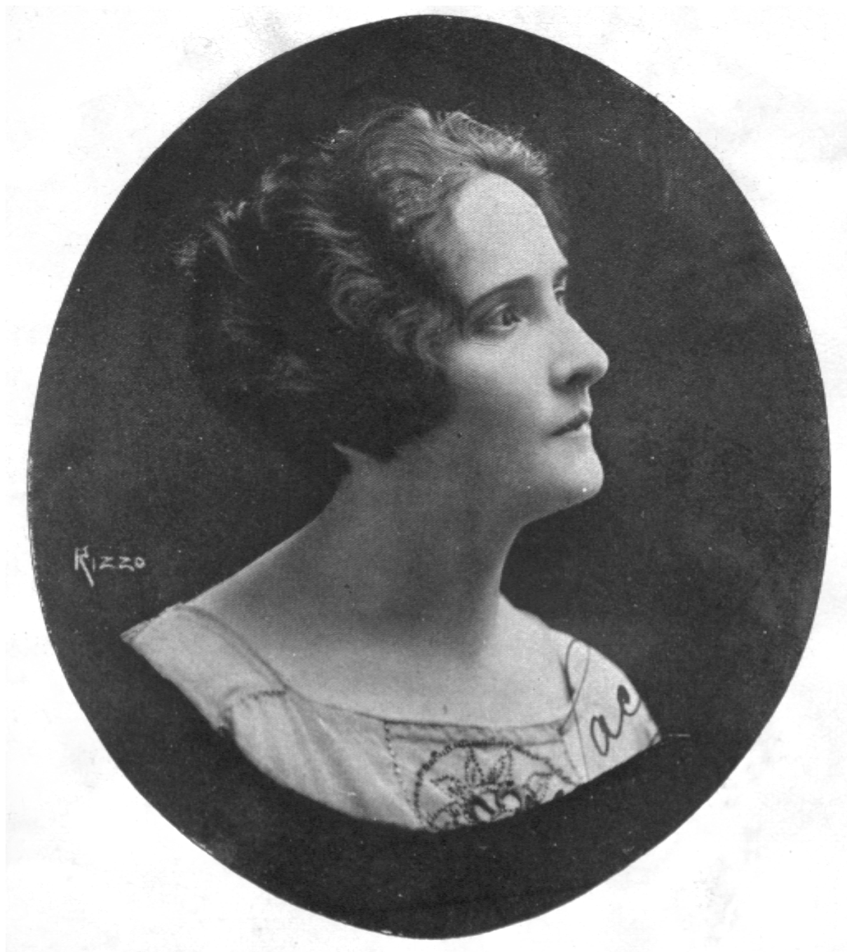
Maria Lacerda de Moura