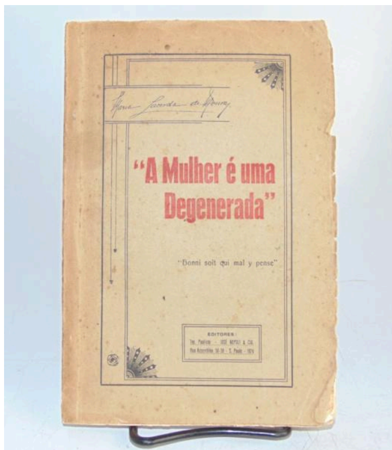
Capa do livro "A Mulher é uma Degenerada" de Maria Lacerda de Moura, 1924