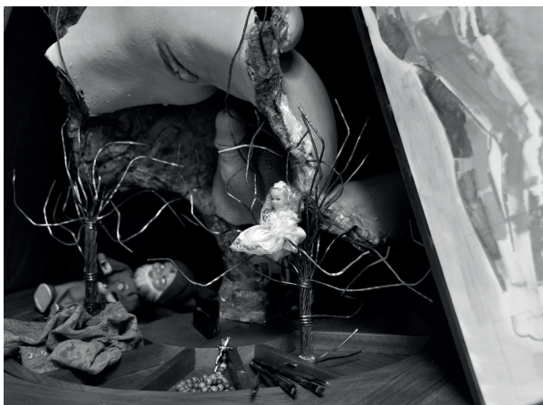
Figura 2: Tabernáculo para Alakazam , detalhe, 2017 (inacabado), técnica mista, 103 cm, 73 cm, 73 cm (quando fechado)

À primeira vista, a assemblage em caixa pode parecer meramente um dispositivo tridimensional que aloja moldes de nossos corpos e uma variedade de outros objetos (Figura 2). No entanto, com um design altamente influenciado pela escritura feminina, sua produção faz parte de uma prática contínua, por meio da qual minha relação com a modelo feminina é constantemente revisitada, remodelada e metamorfoseada. É importante ressaltar que, como um artefato híbrido, ele situa nossos corpos fetichisticamente encaixotados, e até mesmo consagrados, quebrados, em um contexto particular – um quadro de referência rigorosamente identificado conosco enquanto criadores e sujeitos simultaneamente.