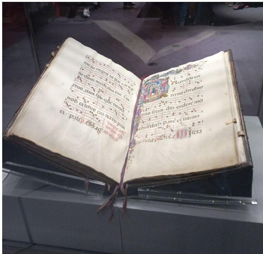
Em exposição na galeria da coleção ocidental na Biblioteca Chester Beatty, Dublin, 2023 – Acervo do autor.