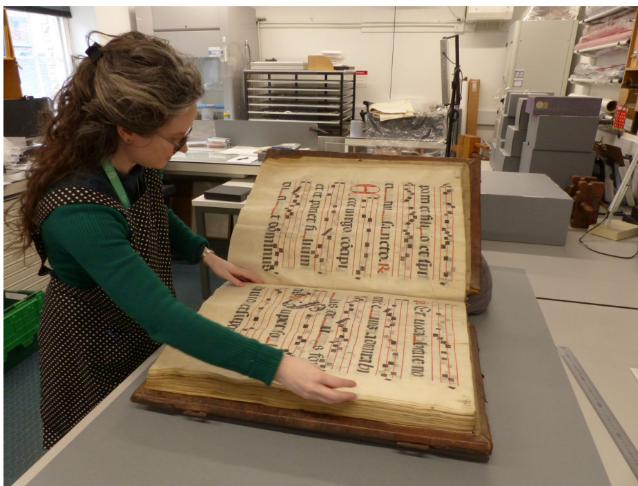
Imagem 2 — Antifonário W217, do século XV.

Processo de restauração no laboratório da biblioteca Chester Beatty, com Maria Montcalm, 2024