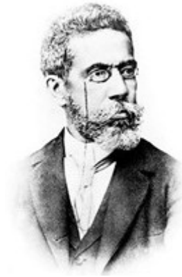
Figura 2 - Machado de Assis