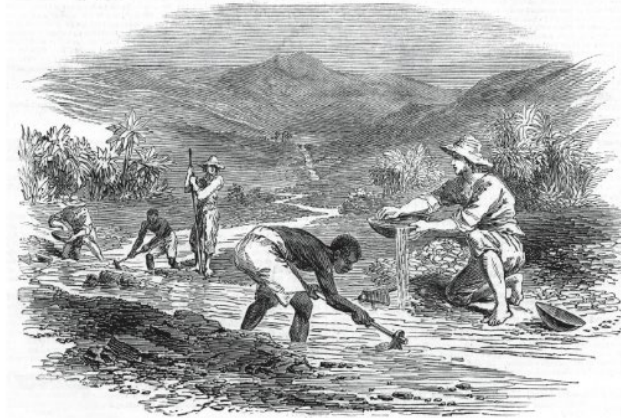
Figura 3 - Slavery