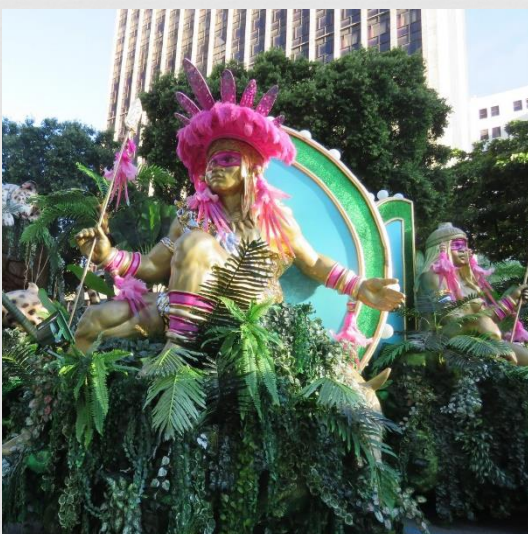
Fig. 17: Carro alegórico – Estação Primeira de Mangueira (2019)