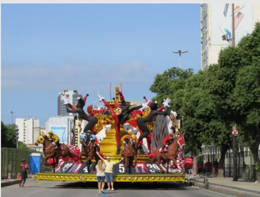
Fig. 15: Carro alegórico – Acadêmicos do Salgueiro (2016)