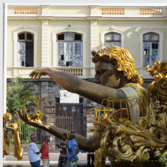
Fig. 18: Carro alegórico – Beija-Flor de Nilópolis (2016)