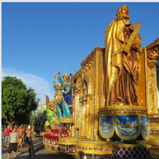
Fig. 09: Carro alegórico – Vila Isabel (2019)