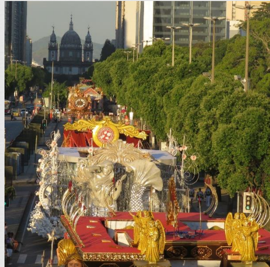
Fig. 04: Carros alegóricos – Salgueiro e Vila Isabel (2019)