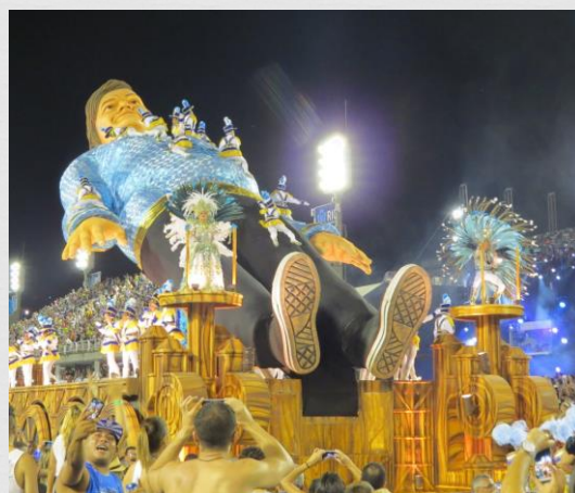
Fig. 02: Carro alegórico – Portela (2016)