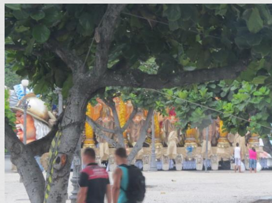
Fig. 16: Carro alegórico – Beija-Flor de Nilópolis (2015)