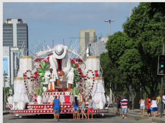
Fig. 08: Carro alegórico – Acadêmicos do Salgueiro (2016)