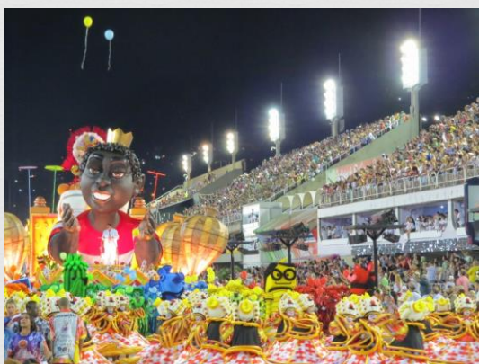
Fig. 01: Carro alegórico – Unidos do Viradouro (2017)