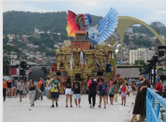
Fig. 14: Carro alegórico – Unidos da Tijuca (2019)