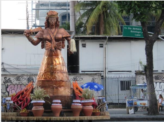
Fig. 13: Carro alegórico – Portela (2019)