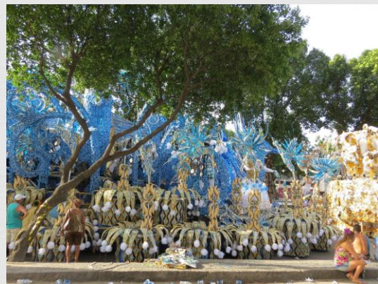
Fig. 06: Carro alegórico – Beija-Flor de Nilópolis (2016)