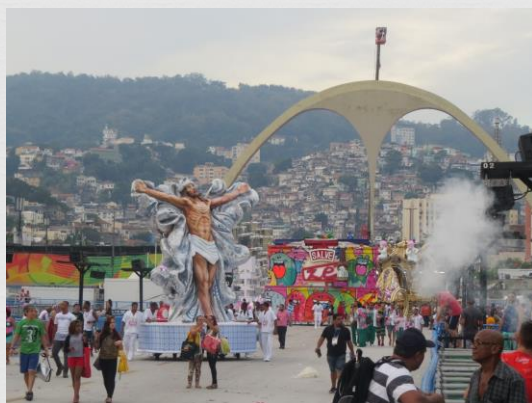
Fig. 11: Carros alegóricos – Estação Primeira de Mangueira (2017)