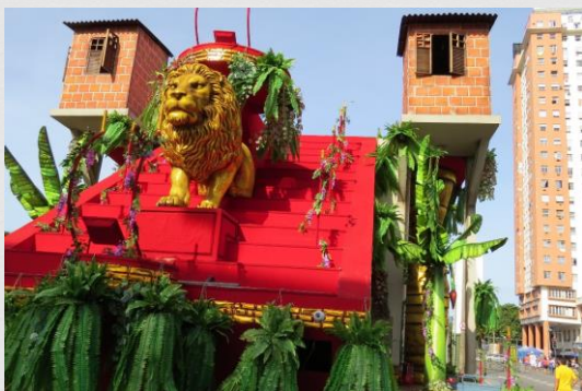
Fig. 07: Carro alegórico – Acadêmicos do Salgueiro (2016)