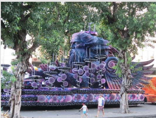
Fig. 05: Carro alegórico – Mocidade Independente de Padre Miguel (2019)