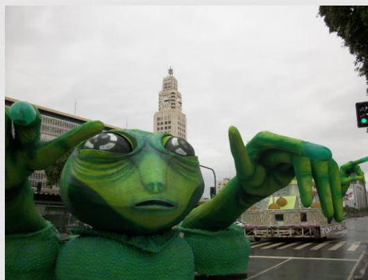
Fig. 12: Carro alegórico – Unidos do Viradouro (2011)