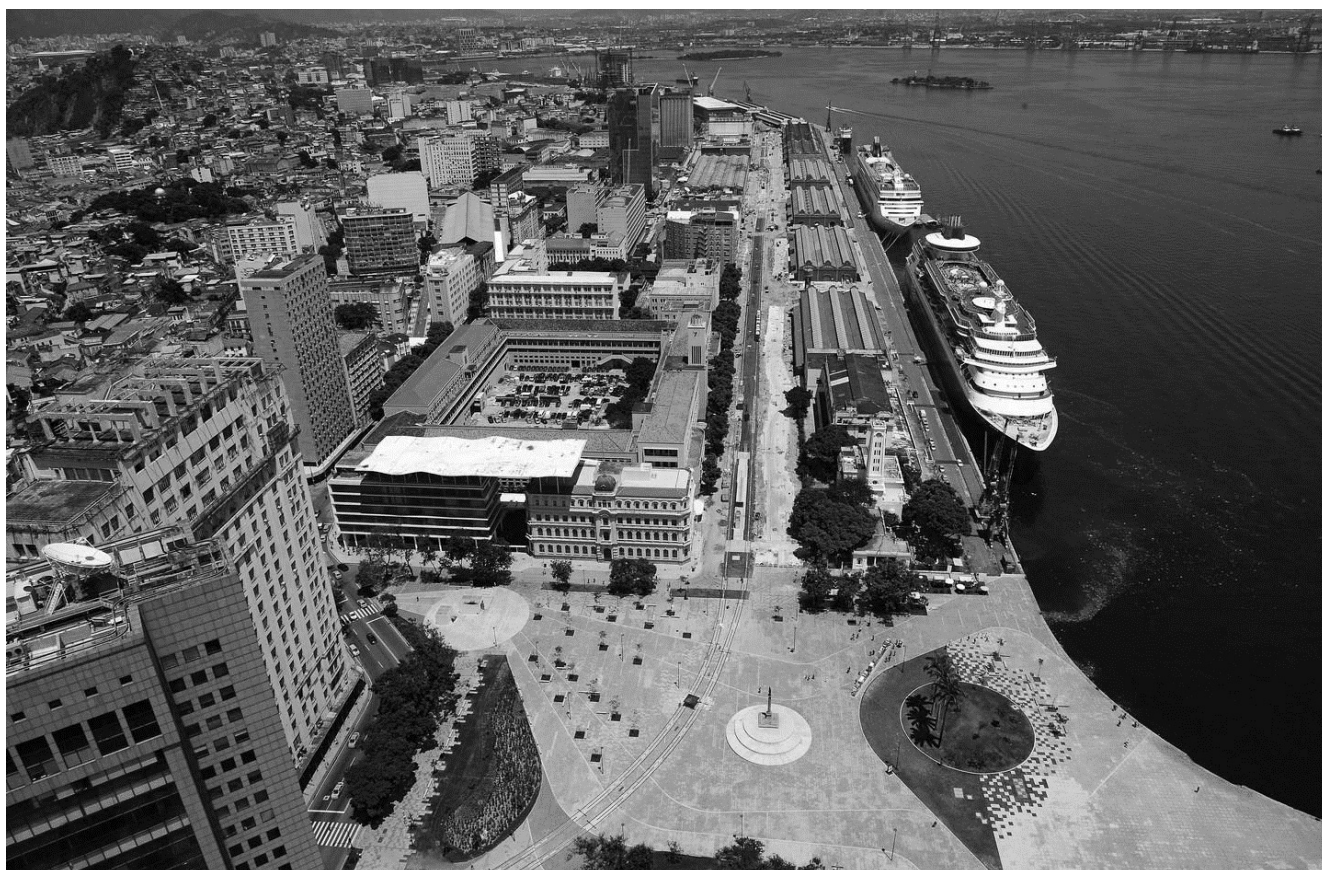
Figura 1. Trecho Projeto Porto Maravilha, 2016.

O Porto Maravilha, projeto de revitalização da Região Portuária do Rio de Janeiro, é uma iniciativa urbano-cultural que teve grande impacto na comunidade local em que se insere. Este projeto compactua com um processo mundial de mercantilização da cidade, ou seja, um processo que determina uma nova relação entre o Estado e o setor privado e um novo tipo de turismo, que acabou por acirrar as desigualdades urbanas do centro da cidade do Rio de Janeiro através da gentrificação, como aconteceu em cidades como Curitiba, Buenos Aires, Montevideú, Nova Iorque, Barcelona e Bilbao.