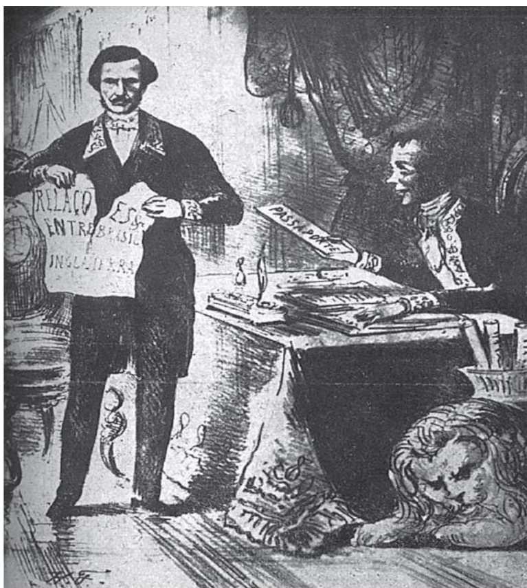
O Conselheiro CARVALHO MOREIRA pede os seus passaportes a Lorde JOHN RUSSELL e deixa a Inglaterra