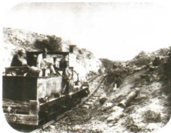
Primeira locomotiva a operar em Pernambuco integrante da Recife-São Francisco Railway, a segunda estrada de ferro construída no Brasil. FONTE: MOURA (2010), p. 181

Convém assinalar, como exemplo de empreendimento britânico no setor ferroviário, a Recife and São Francisco Railway Company , primeira estrada de ferro britânica do país, partindo de Recife e unindo, rumo ao sudoeste, a região navegável do Rio São Francisco, fundada com a criação da companhia gestora no ano de 1853 em Londres. Tratou-se da segunda via férrea do Brasil, a partir do empreendimento dos irmãos britânicos Edward e Alfred de Mornay, que receberam autorização do Império para de construir e explorar a ferrovia para escoar a produção de algodão e açúcar da área, sendo, inclusive, a primeira concessão estatal a ter como condição obrigatória o emprego apenas de trabalhadores livres em sua construção. Mesmo com o apoio de Mauá, quem criticou a postura de um dos engenheiros estrangeiros, cujo planejamento não contemplava estudo deliberado e sistemático das condições do terreno, além de a movimentação na linha férrea ter sido bastante escassa, assim como os lucros gerados, a ferrovia fracassou, sem que a bacia do São Francisco fosse alcançada, gerando custos para o Império em termos de juros. Não obstante, foi resgatada pelo regime imperial em 1883, e, em 1887, foi acrescido o trecho que une Garanhuns-PE a Una-BA. No começo do século XX, foi incorporada pela empresa britânica The Great Western Railway Company .