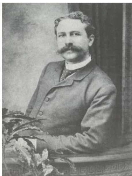
JOAQUIM NABUCO - FONTE: ALONSO (2015), p. 167

Nesse contexto, cabe destacar que as teorias raciais tiveram grande difusão na Europa a partir da segunda metade do século XIX, chegando ao Brasil mais tarde. Esse conjunto de visões, “bando de ideias novas” 178 , incluía: evolucionismo; darwinismo social; positivismo; naturalismo determinista. Foram muito bem recebidas e internalizadas pela reduzida elite intelectual do país que se reunia nos diversos estabelecimentos científicos de ensino e pesquisa criados no século XIX. Ademais, a década de 1870 será caracterizada pelo avanço do paradigma positivista-evolucionista, segundo o qual os modelos raciais exerceram papel de destaque. Assistiu-se, igualmente, ao fortalecimento e ao amadurecimento de alguns centros de ensino e pesquisa nacionais, tais como os museus etnográficos, as faculdades de direito e medicina e os institutos históricos e geográficos 179 .