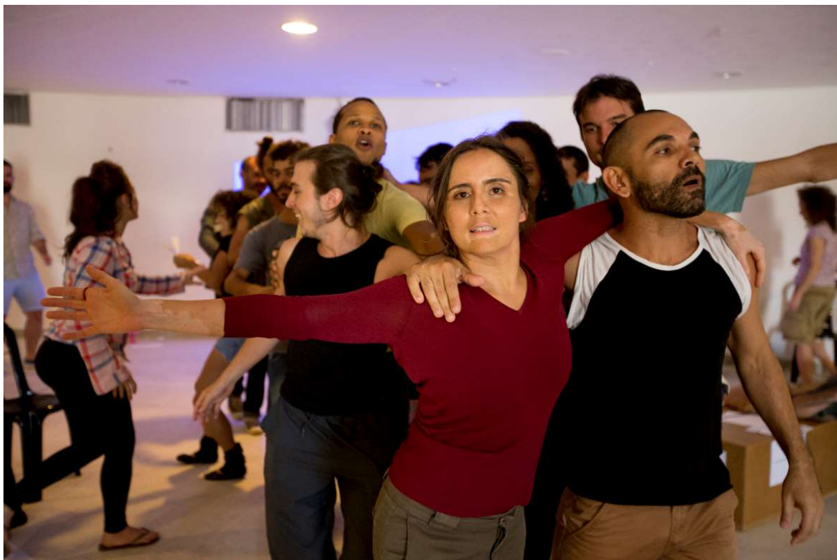
Figura 12 – Prática Aisthesis , Museu da República, 2014.