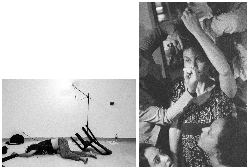
Figura 18 – 1. Prática Aisthesis , Museu da República, Brasília, 2014. 2. Prática Aisthesis , Café Balaio, Brasília, 2015.

Na Prática Aisthesis , colocada como processo inventivo, nos interessa exatamente que as formas e seus modos de constituição nos surpreendam, nos provoquem, por nos colocar em contato com o desconhecido, inabitual, sendo nós nos diferenciando de nós mesmos.