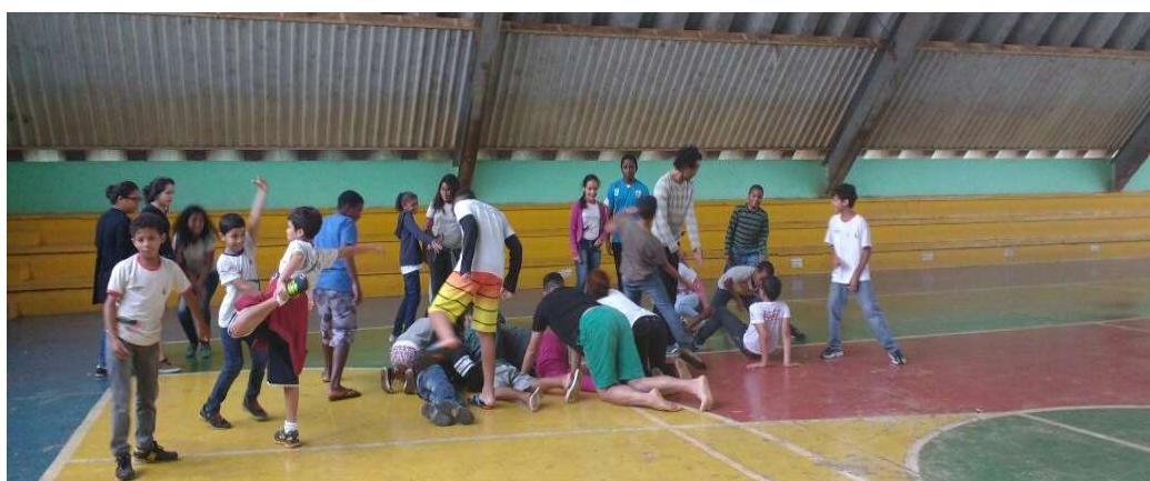
Figura 23. Prática Aisthesis , escola CAIC/UNESCO de São Sebastião, 2016.

No Aisthesis a gente precisa escutar essa linguagem do encontro, que é sobre a falência dos códigos que já temos (como artistas), porque temos uma overdose desses códigos inteligíveis, mas às vezes muito abstrato, porque é muito poético e subjetivo... [...] Para mim foi uma conquista ver que a presença da gente não era distante, não era higiênica. Que eles, de fato, estavam juntos com a gente construindo algo, naquele espaço que era comum para eles e não comum para gente, fazendo uma coisa que, talvez, fosse comum para gente e não comum para eles, mas que no fundo era território incomum para todos, nessa instância da imprevisibilidade. (informação pessoal) 71