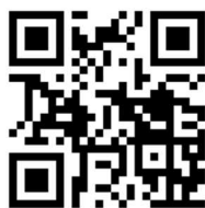
Video 3. Prática Aisthesis com estudantes UnB, 2016. 28

A partir de uma disponibilidade e abertura de nossas atitudes e de um desprendimento da expectativa de retenção, foram ativados estados de atenção diferenciados, sensíveis, numa oscilação entre focar algo e deixar a atenção livre, sem prender-se demasiadamente em algo mais pontual. Ficamos atentos às circunstâncias, a cavar nas situações o seu potencial de desdobramento e ao mesmo tempo desapegados delas, numa tentativa de permitir que elas fluíssem, como se assim aprendêssemos sobre a intensificação dessa fluidez.