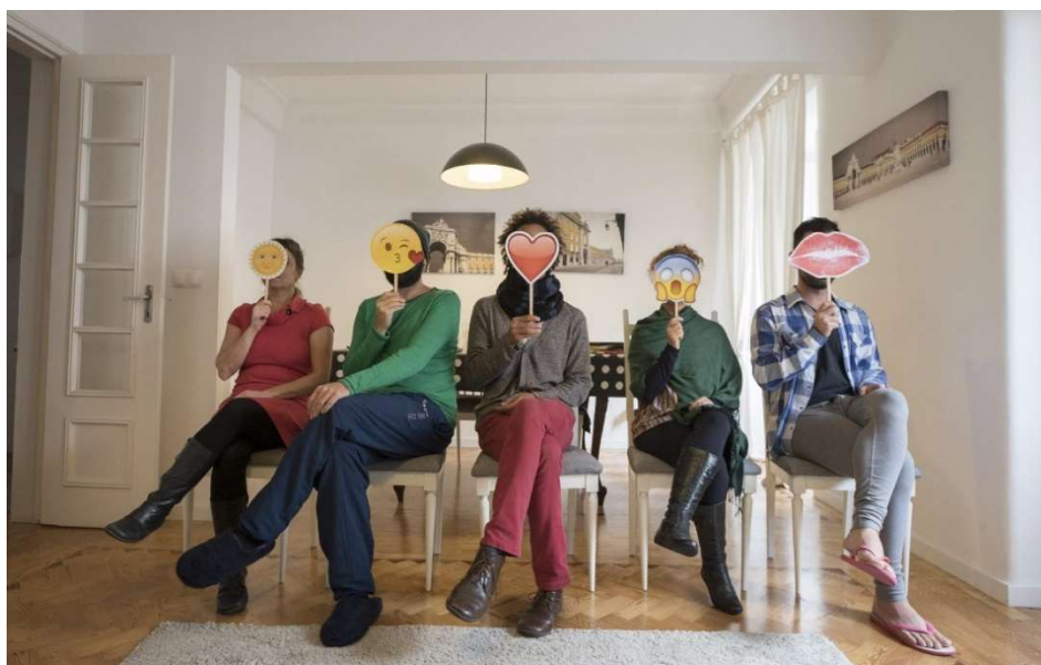
Figura 6 – Leitura dramática do whatsapp realizada em Lisboa, 2017.

ocorressem no mesmo espaço. O público era convidado a participar dessa programação, com duração de três a quatro horas. Às vezes, essas atividades eram divididas em dois dias de evento.