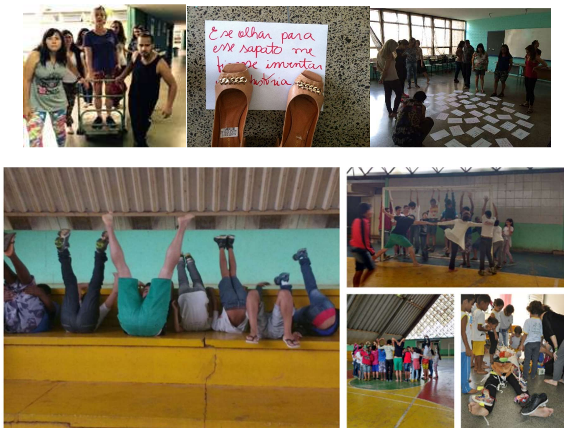
Figura 7 – Prática Aisthesis com professores e em escolas públicas do DF, 2016.

Como o interesse desta tese se volta ao trabalho da (o) atuante cênico, não me aterei, nesta fase, à discussão das possibilidades de construção dramatúrgica a partir da Prática Aisthesis . Neste capítulo darei ênfase à primeira fase do projeto, que marcou a constituição da Prática Aisthesis . Entretanto, a segunda etapa e os desdobramentos que realizei posteriormente, de maneira mais independente, serão também mencionados na medida de sua necessidade.