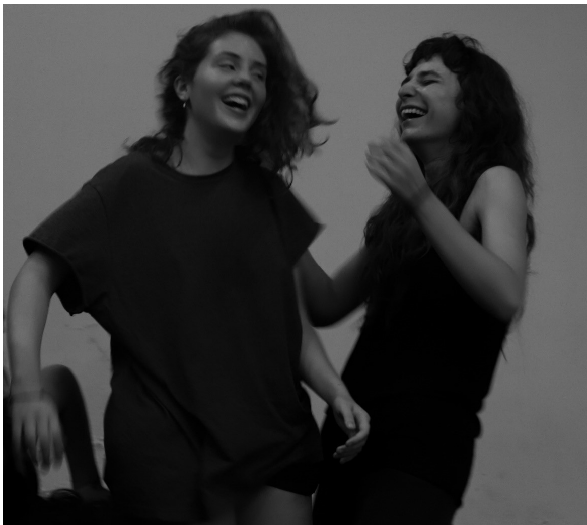
Figura 22. Prática Aisthesis , turma de TEAC, 2019.