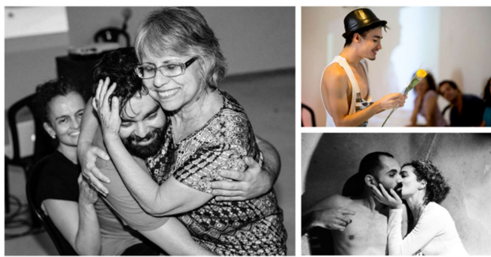
Figura 14 – Prática Aisthesis textura vovó, 2014.

Essa aproximação desarmada, a meu ver, não deixou de se constituir como uma estratégia para se fazer perceber possíveis fronteiras, de como elas vão se impondo, sobretudo quando a estrutura contextual se coloca imperiosa. Vamos devagarinho, empurrando e deixando ser empurrado, tateando o campo, mas arriscando na intuição da possibilidade do alargamento, e da possibilidade de abrir fendas, amistosamente.