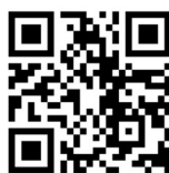
Vídeo 5. Processo do espetáculo De água e sal 53 .

Como resultado deste processo chegamos ao espetáculo De água e sal 52 que foi considerado e divulgado como um laboratório cênico de dança-performance para o exercício da interpretação, tendo como interesse a investigação sobre estados pré-expressivos no contexto de atuação. A seguir, o leitor poderá ver um trecho do processo deste espetáculo.