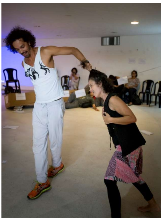
Figura 20. Prática Aisthesis , Museu da República, Brasília, 2014

Como não houve, necessariamente, uma obrigatoriedade de estabelecer algum tipo de relação com os diversos estímulos, com os corpos em atravessamentos de afetos, sinto que a Prática ampliou em mim a possibilidade de agregar esses estímulos ao mesmo tempo que pude perceber minhas limitações. Cada vez mais a atenção se abriu para novas percepções de espaços-tempos-outros, começando a perceber o jogo incessante entre corpos-mundos-corpos-mundos-corpos-mundos.