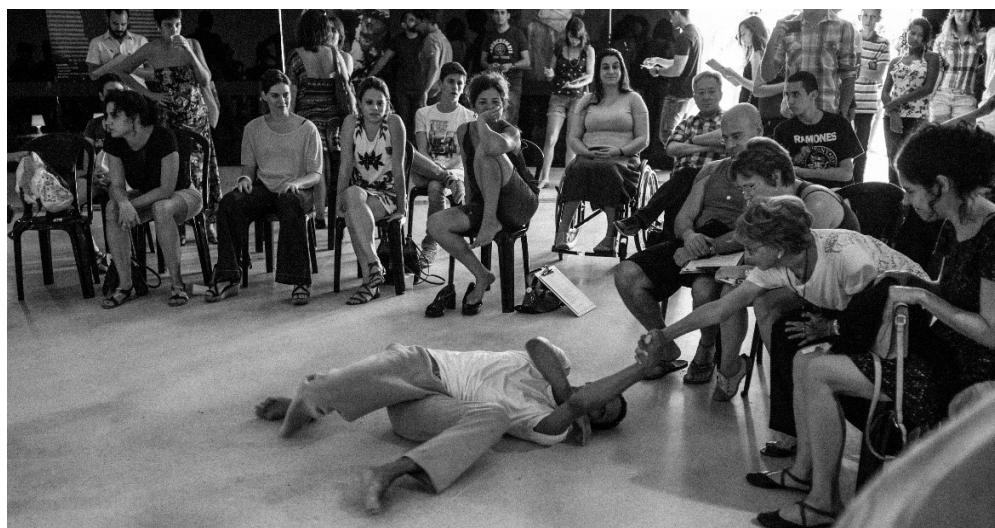
Figura 5 - Prática Aisthesis – Museu da República, 2014.

entre os elementos que dele participa. Podemos inserir também a ideia de encontro a partir da consideração desse evento coletivo como grupalidade 11 que se dá como campo de afecções entre os corpos que se compõem e se decompõem de acordo com o grau de abertura a essas afecções.