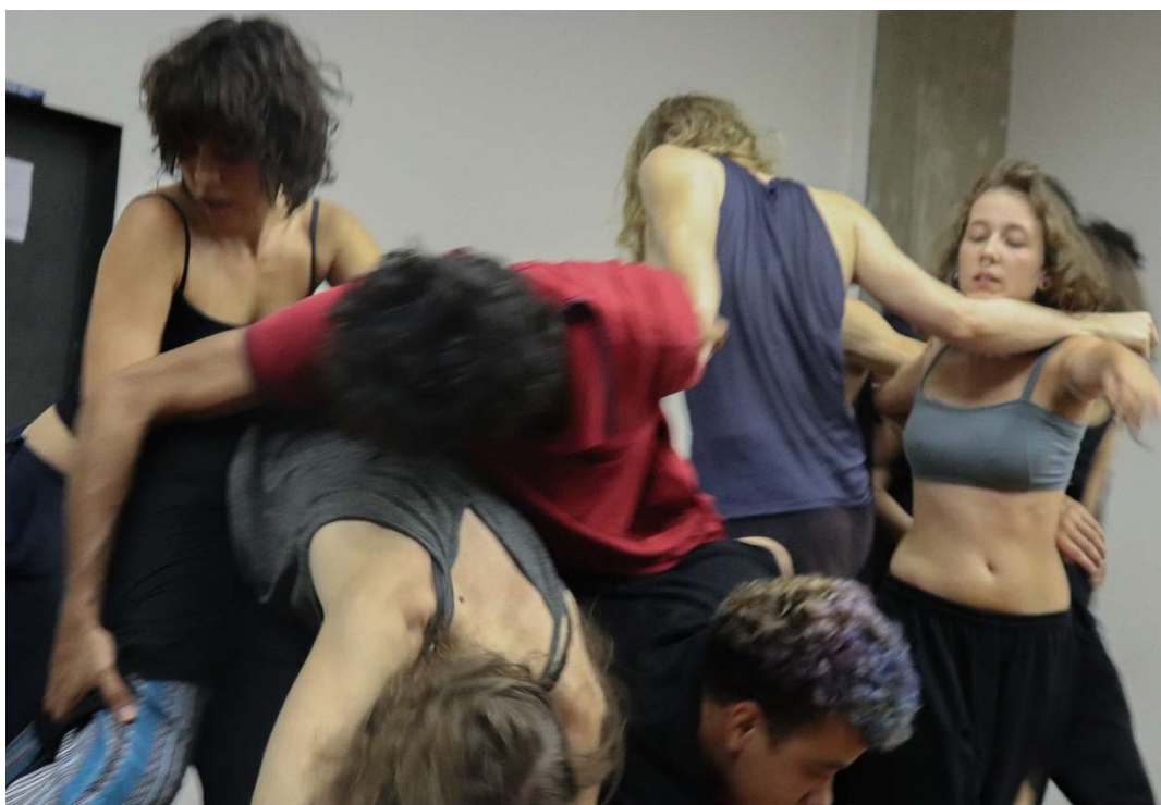
Figura 13 – Prática Aisthesis , turma TEAC, 2019.

tudo” (informação pessoal) 43 . Então, poderia dizer que a Prática propicia um campo sensível de possibilidades, e este campo sensível é a própria definição de grupalidade.