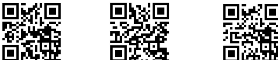
Vídeo 6. Exercícios para nada 58

Nas turmas da disciplina TEAC, o para nada , muitas vezes, foi utilizado como um aquecimento do sensível, e enunciado sem muitas explicações, exatamente para oportunizar a possibilidade de desencadear maneiras diversificadas de se experimentá-lo.