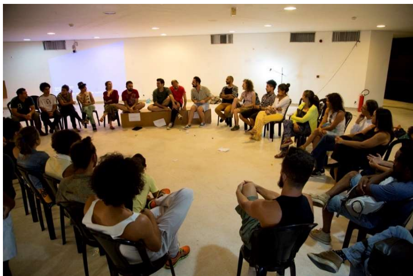
Figura 10 – Roda de conversas – Museu da República, 2014

Após cada Prática realizamos rodas de conversas, nas quais os participantes compartilharam impressões, curiosidades, e entre nós repassamos pela experiência tentando recordar momentos marcantes, sentimentos, focos de atenção em determinado aspecto, composições vocais ou corporais disparadas pelos fluxos, temas emergentes, imagens disparatadas. Dessa maneira, mapeamos nossas tendências de atuação, como por exemplo, como cada um abordou as ações, os movimentos, a espacialidade, a relação com outro, a forma de falar, a maneira de colocar um texto em evidência. Ao mesmo tempo trocamos impressões sobre o que de novo pareceu surgir para cada um, o que o coletivo modificou em cada um, sobretudo na maneira de se colocar em situação, se disponibilizar para experimentar possibilidades não muito familiares, tanto no contexto coletivo, quanto no individual. Nessas conversações levantamos questões, que mesmo não trabalhando sobre elas especificamente num próximo encontro, orbitaram na nossa nuvem de questões pessoais e acabaram por ser experimentadas na Prática sem que tivéssemos combinado.