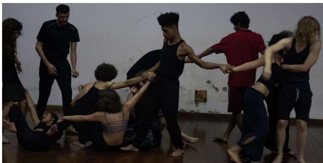
Figura 21 – Exercícios Amálgama, turma de TEAC, 2019.