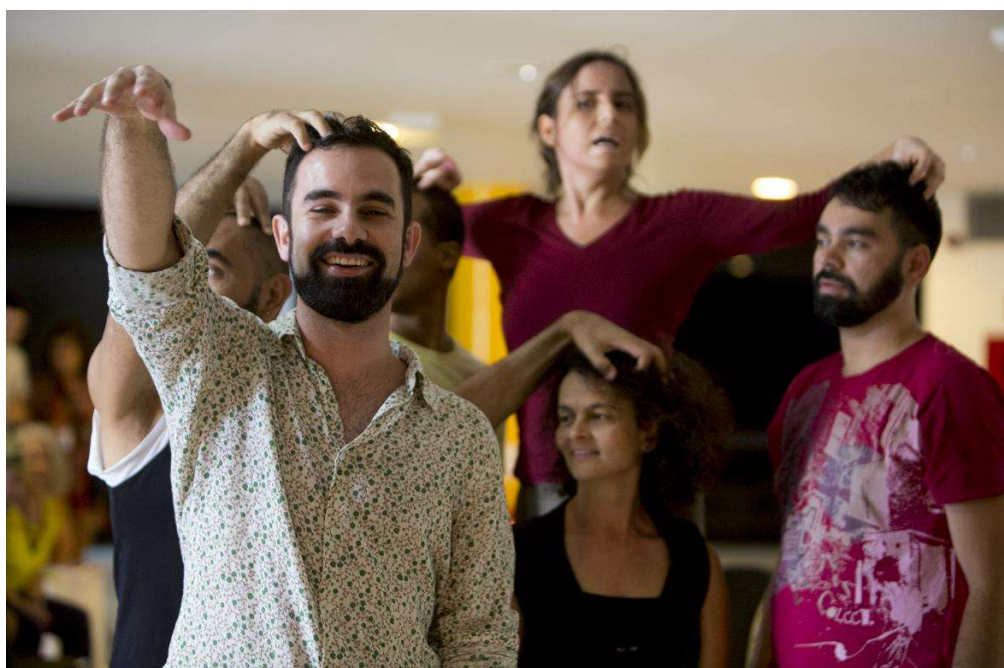
Figura 3 – Prática Aisthesis – Museu da República, 2014.