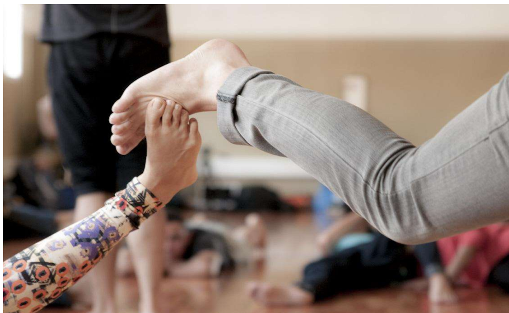
Figura 9 – Prática Aisthesis – IFBrasília para turma de calouros, 2014.

Primeiro é preciso se deixar levar pelo fluxo das coisas. Esse fluxo desmedido, descontrolado, louco. É preciso deixar se penetrar por uma inconsciência, por uma inconsistência, sem querer saber muito. Perceber aos poucos, tatear e desconfiar sempre, mas seguir tateando, aguçando a atenção sobre as recorrências, seus modos de emergência, seus mecanismos de relação com as coisas, e também sobre o inusitado. Sentir. Perceber. Embora sempre diferente, se detecta uma aura (consistência?), um afeto e sentimento sobre aquilo que retorna, de como ele ecoa no músculo e no pensamento, de como ele força o corpo. É na experiência de um fluxo, na apreensão das sensações corporais e sua rota no músculo que talvez se apreenda possibilidades de caminhos inventivos. 23