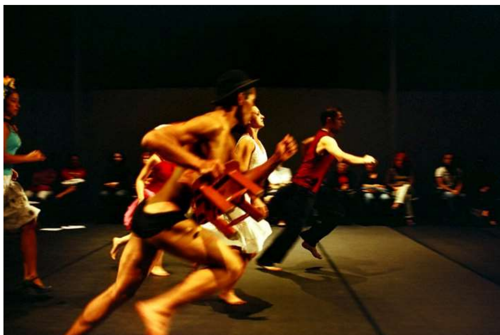
Figura 17 – Grupo Basirah, espetáculo De água e sal , 2006.

Com o grupo Basirah como objeto de pesquisa, realizei meu mestrado, período em que trabalhei o estímulo e a sensibilização da percepção da (o) atuante cênico para uma escuta mais aguçada de seus processos psicofísicos na atividade criadora. Objetivei aumentar sua consciência para seus estados físicos, tanto no momento da criação de materiais, como na atuação cênica. Ademais, busquei uma maneira de viabilizar para a (o) atuante cênico uma compreensão mais aprofundada de seus processos que pudesse ajudar na integração mais íntima com seus próprios materiais.