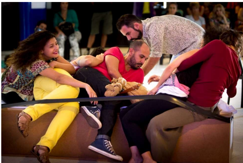
Figura 19 – Prática Aisthesis , Museu da República, Brasília, 2014.