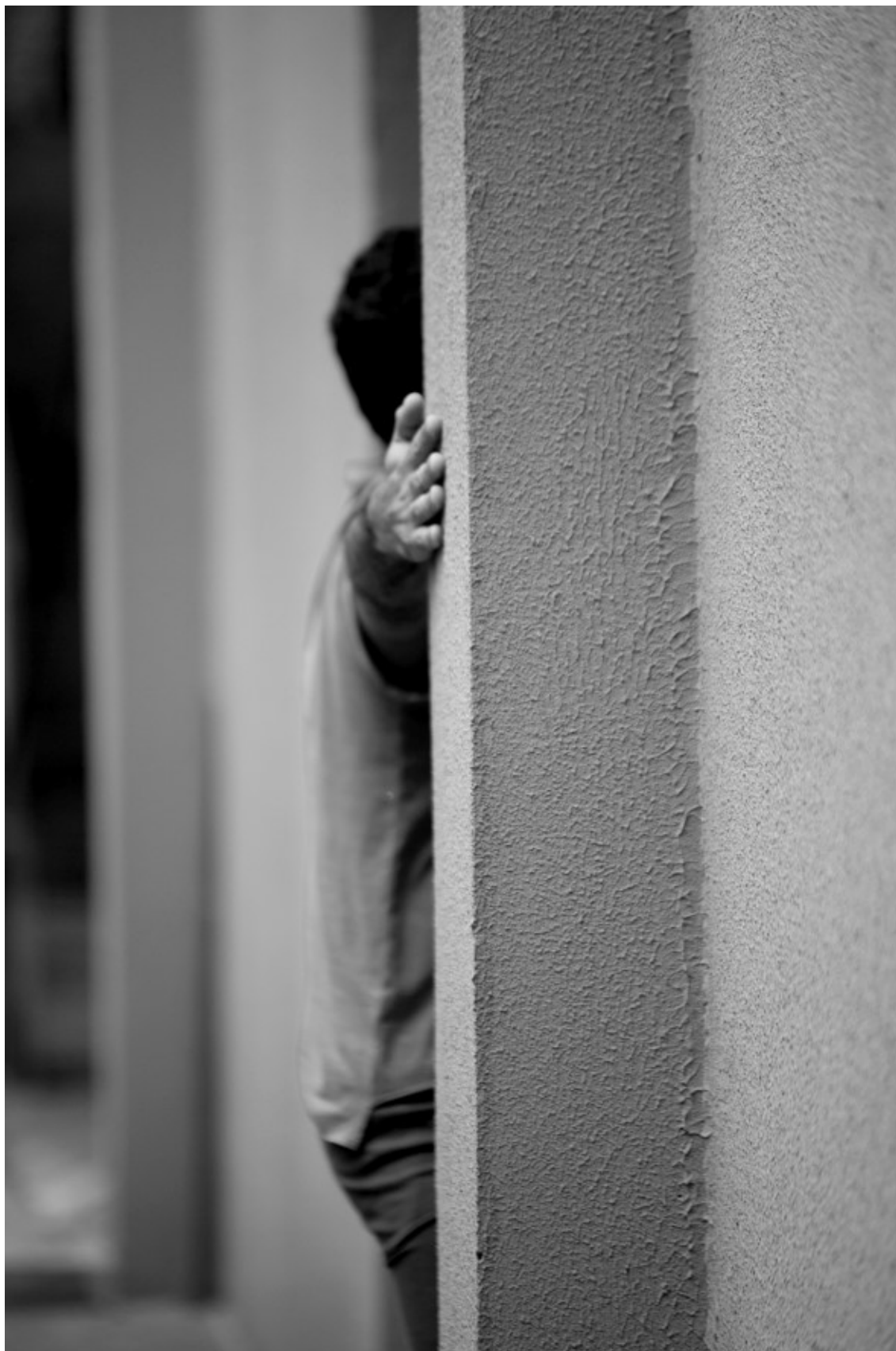
Figura 1. Prática Aisthesis – Galeria Alfinete, 2014.