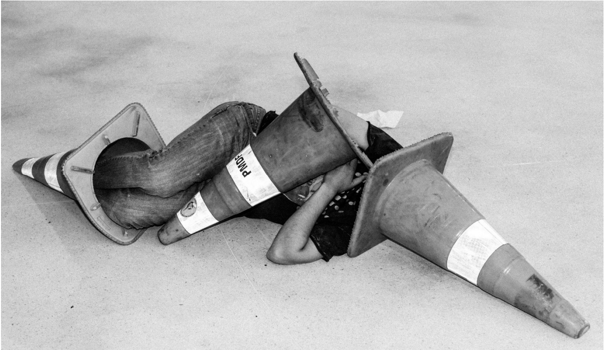
Figura 15 – Prática Aisthesis , Museu da República, 2014.

em velhos modos de ver e fazer e relacionar com as questões de maneira a querer controlá-las, apaziguá-las, especialmente se não estivermos atentos e abertos aos diferentes pontos de vista que cada um expõe.