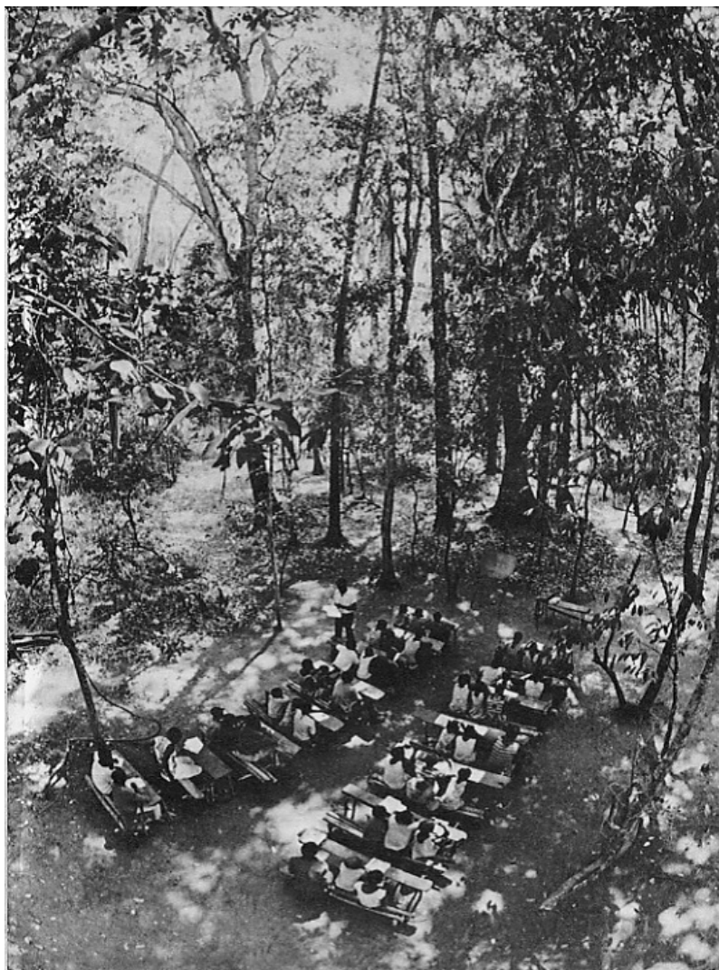
Figura 1 – Escola em uma zona libertada. Período da luta de libertação.

O mesmo autor, ainda sobre a obra freireana, destaca a importância da Guiné-Bissau no pensamento e influência na sua Pedagogia da Correspondência, tendo sido o primeiro de quatro livros que o autor dedicou ao tema: Cartas à Guiné-Bissau (1977), Professora Sim, Tia Não: Cartas a Quem Ousa Ensinar (1993), Cartas a Cristina (2003) e Pedagogia da Indignação: Cartas Pedagógicas (2000).