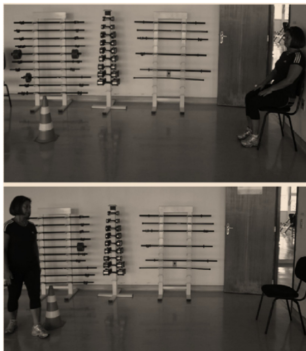
Figura 2 – Agilidade/Equilíbrio dinâmico.