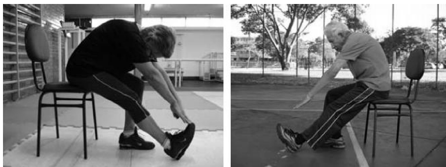
Figura 1 – Sentar e alcançar.

acometimento das articulações. Além disso, sugere-se ao avaliador, a explicação e a demonstração do teste, além da execução de uma tentativa por parte do avaliado, para induzir familiarização com o teste: