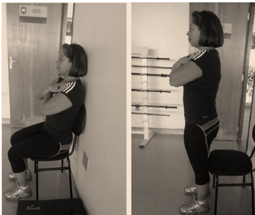
Figura 3 – Sentar e levantar.

com o cone e, no momento de sentar-se na cadeira, finalizando o teste, ter cuidado com os impactos do quadril com a cadeira e da cabeça na parede onde estará encostada a cadeira.