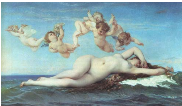
Alexander Cabanel – O Nascimento de Vênus (1863)