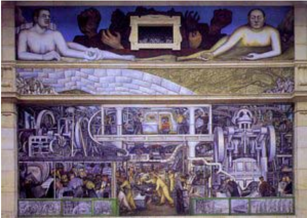
Diego Rivera – Detroit Industry (1932-33)