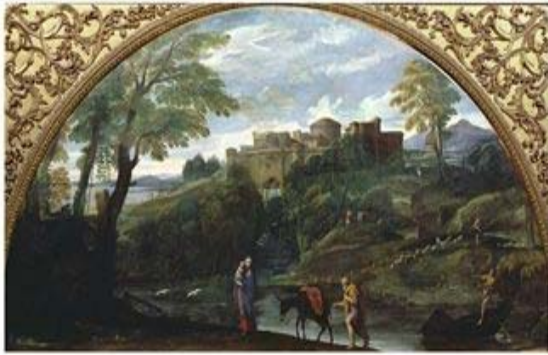
Annibali Carracci – Fuga Para o Egito (1604)