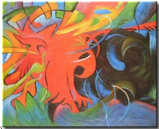
Franz Marc – Embate das Formas (1914)