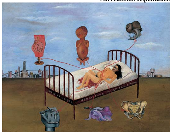
Frida Kahlo – Hospital Henry Ford , 1932.