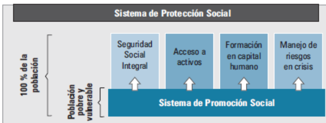
Gráfico 4– Estrutura do Sistema de Proteção social na Colômbia