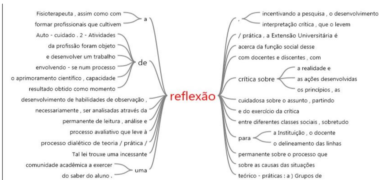
Figura 7: Árvore de palavras do termo Reflexão

A pesquisa em torno dos termos crítico e humanista, não trouxe resultados significativos estando esses geralmente ligados ao termo reflexivo ou formação generalista. Já a pesquisa em torno do termo reflexão trouxe resultados contundentes, conforme se pode observar na próxima figura.