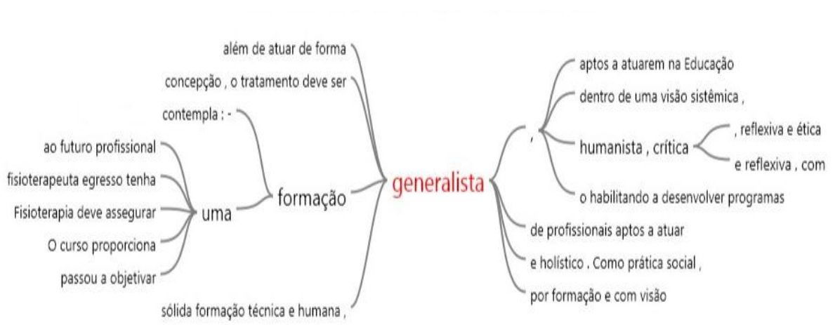
Figura 6: Árvore de palavras com o uso do termo Generalista

O uso do software NVivo 10 nos permitiu identificar os trechos dos PPC relacionados aos termos generalista, crítico, reflexivo e humanista. A Figura 6 expressa o gráfico em árvore relacionado à utilização do termo generalista nos documentos analisados.