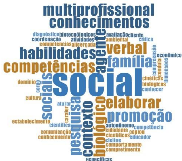
Figura 5: Palavras mais frequentes utilizadas para designar o conjunto de habilidades e competências para os egressos do curso de fisioterapia.

A Figura 5 demonstra a nuvem com as 50 palavras mais frequentemente utilizadas pelas IES estudadas para caracterizar as competências para formação do fisioterapeuta: