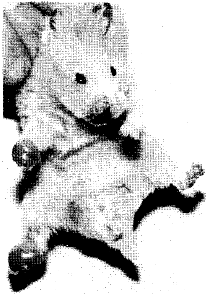
Fig. 1 - Fotografía de las lesiones desarrolladas por la muestra LTB-0016, Leishmania mexicana amazonensis , 45 días después de inoculada. Nótese la formación de grande lesión parasitaria metastásica en la pata anterior.

La metástasis fue un fenómeno constante, presentándose en localizaciones diversas tales como base de la cola, bolsas escrotales, patas anteriores y orejas. La visceralización, en bazo e hígado, también fue establecida. El parasitismo fué intenso y los amastigotas fueron típicamente de L. mexicana . En los cortes histológicos de los histiocitomas numerosos macrófagos llenos de parásitos fueron siempre observados (Figura 1).