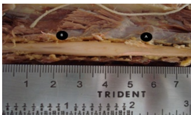
FIGURA 2. Fotografia da intumescência lombar em gatos sem raça definida ( Felis catus ) após retirada da musculatura lombar e secção dos arcos vertebrais. A= início da intumescência lombar; B= final da intumescência lombar.

Com relação à nomenclatura, todos os autores pesquisados seguem a terminologia de