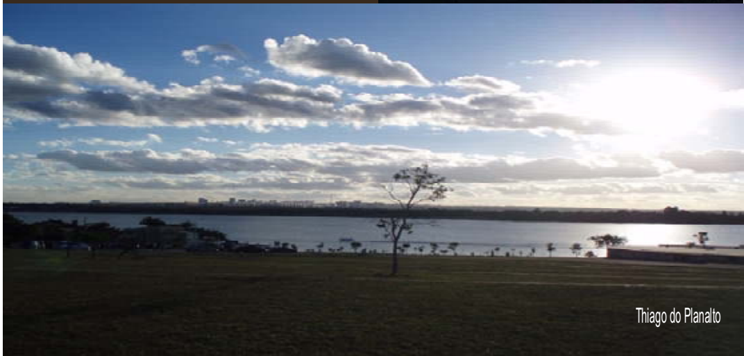
Thiago do Planalto