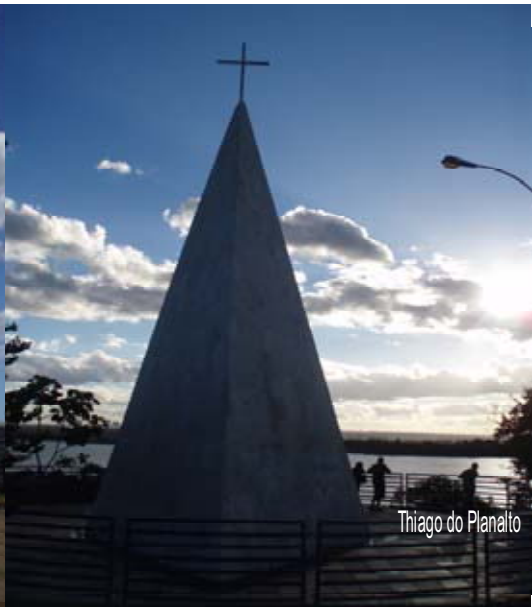
Thiago do Planalto