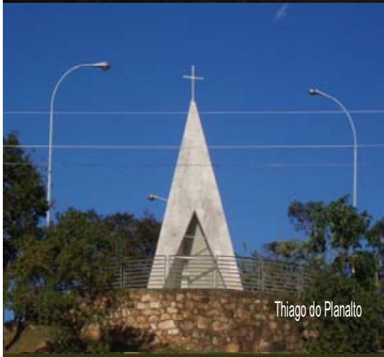
Thiago do Planalto