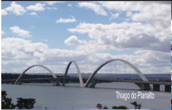
Thiago do Planalto