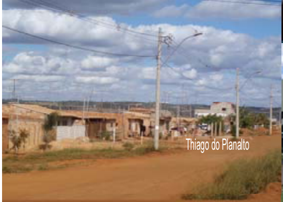
Thiago do Planalto