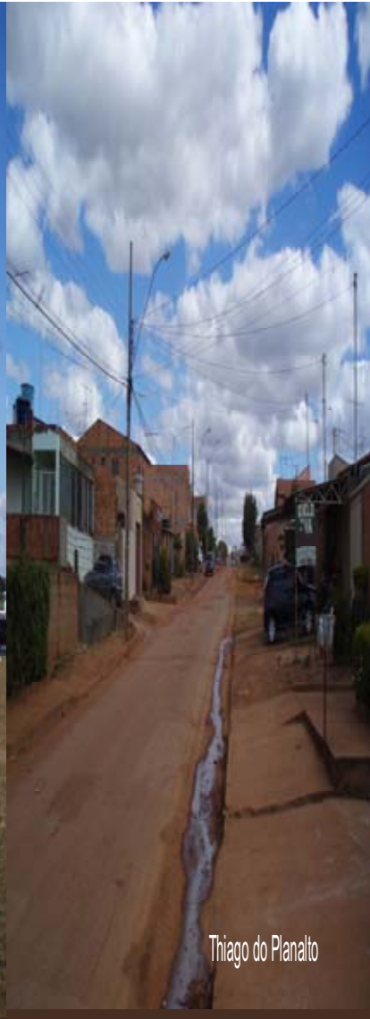
Thiago do Planalto