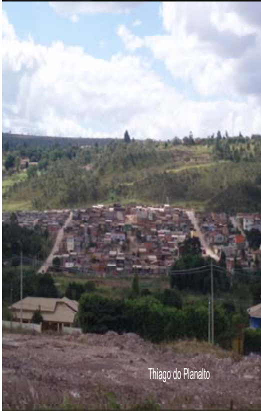
Thiago do Planalto